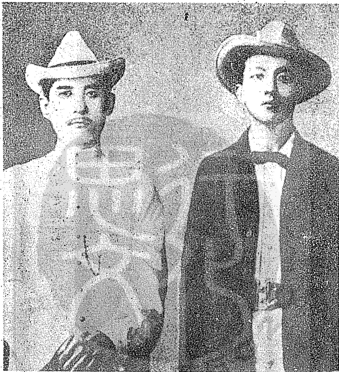
馬君武士(右)在日本就讀時期，與孫中山先生合影。

，恭聆革命宗旨，使他有撥雲霧而見青天之概。他對中山先生崇仰敬服，無以復加，從此改變了他的人生路向，每每在大庭廣眾間放言高論：