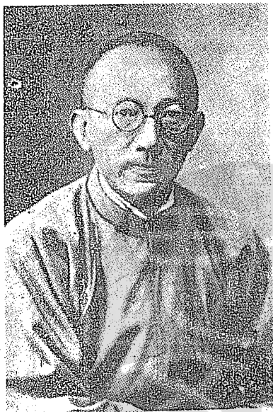
民國十一年時，任廣西省省長馬君武先生。