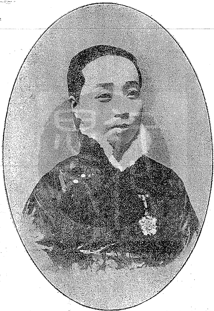
○影留通南在士女壽沈神針聖繡的重敬為最直季張