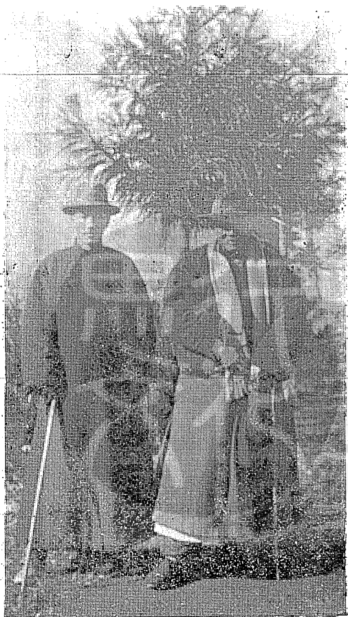
吳稚暉（右）遊川滇黔之前與 蔣委員長（左）在廬山谷影。

『雲成五彩現奇光，形似尼珠不可方，更有一樁奇異事，人人影在個中藏。』 這首詩，便是描寫這個景色。佛光主要是太陽透過水蒸氣形成。太陽祇有一個影子，所以人影倒映下