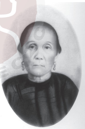
孫中山之母楊氏畫像。