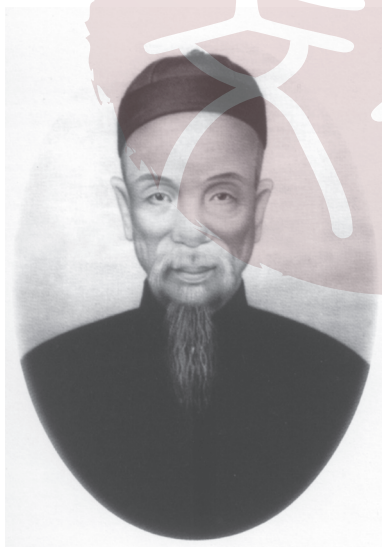
孫中山之父孫達成畫像。

成（一八一三—一八八八年），為了生活，在十六歲時被迫離鄉背井，到澳門打工，先是學裁縫，後來又在外國人辦的一家鞋鋪當鞋匠，每月工錢只有四元。他一直幹到三十二歲，當薄有積蓄時，才回鄉結婚安家。後來主要依靠佃耕二畝半田地，並兼作村中更夫，為村裡人打更報時，一年可得谷十二石來養家糊口，以維持全家人的生計。他的母親是距翠亨不遠的隔田村（今崖口鄉）農民楊勝輝之女楊氏（一八二八—一九一〇年），這是一位溫柔善良而又非常勤勞儉樸的農村婦女，不僅料理家務，還參加輔助性農業勞動。孫中山有兩個叔父，孫學成（一八二六—一八六四年）、孫觀成（一八三一—一八六七年）。他們因在家鄉難於謀生，只好離鄉，先後遠赴美國金礦當華工，在異國苦苦掙扎，最後均身遭不幸，一人病逝海外舊金山，一人葬身