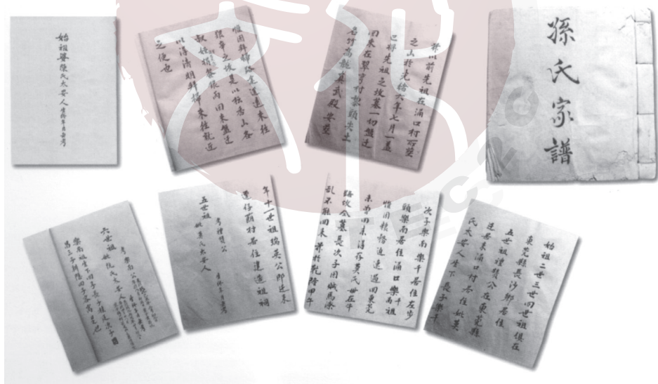
記載孫中山家族來源的翠亨《孫氏家譜》

子樂千、次子樂南，樂千居左埗頭，樂南居湧口……」以往，從翠亨孫氏歷代口碑相傳及《孫氏家譜》，人們都認為孫中山祖先是在明代從廣東東莞縣遷移到香山縣來的。上世紀三十年代一些刊物所發表的關於孫中山先世狀況的文章，以及一些成書如《總理事略》等，均采是說。因此，這一說法已成定論。但是，自從一九四二年廣州中山大學教授羅香林著《國父家世源流考》一書出版後，長期以來關於孫中山的祖籍問題，便出現有東莞、紫金兩說。羅香林否定孫中山祖先從東莞縣遷來香山的成說，提出孫氏十二世連（璉）昌公於清初始從廣東省紫金縣增城輾轉移居香山的論點。在近半個世紀中，這一問題一直有爭論，到八〇年代，海內外均有學者發表著作研究孫中山的祖籍問題，東莞、