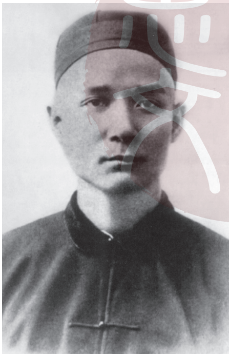
一八八三年十七歲時的孫中山。

粗略一算，孫中山一生取用過的名、字、號和化名、筆名確實很多，據不完全統計，總數竟達五十多個。其數目之多，並世政治人物中似無出其右者。他的取名、改字、擇號、化名、筆名等，都有內在的含義。所有這些名號都反映了他所進行的鬥爭和他的意向。從這一側面，也可以在一定程度上窺視出孫中山一生的斑斕多彩和奮鬥歷程的艱苦辛勞，並為後人理解他的思想、活動和人生觀念變