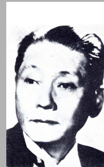
蔣方震（百里）先生 1882-1938 年。