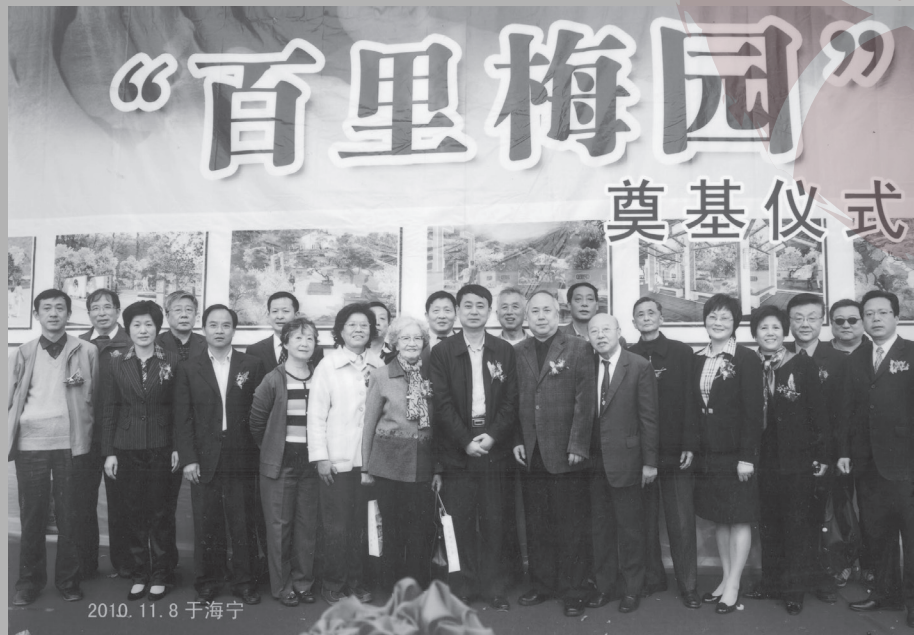
2010年11月8日蔣百里墓園在故鄉浙江海寧市東山舉行奠基禮時，當地領導和家屬合影。