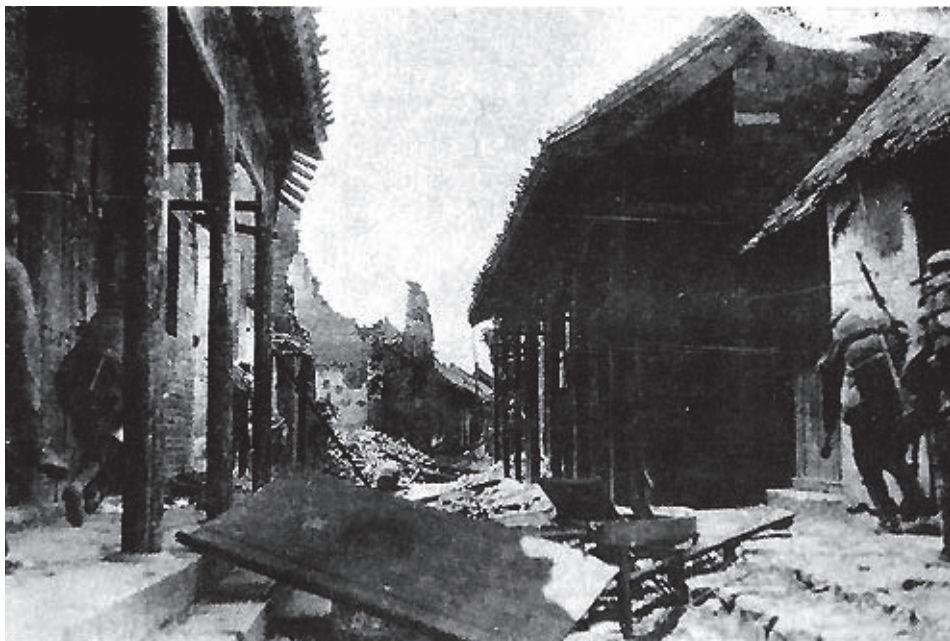
中國軍隊與日軍在臺兒莊內進行巷戰