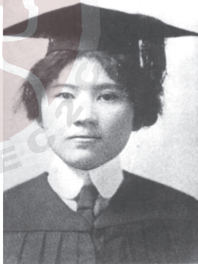
一九一三年，宋慶齡在衛斯理安女子學院畢業，獲文學士學位。

在宋氏三姐妹中，宋慶齡是唯一受到系統的西洋教育而未被西洋化，並善於吸收西方之長的佼佼者。美國每個州都有自己的信條。宋慶齡求學所在的喬治亞州的信條是「賢明、公正、