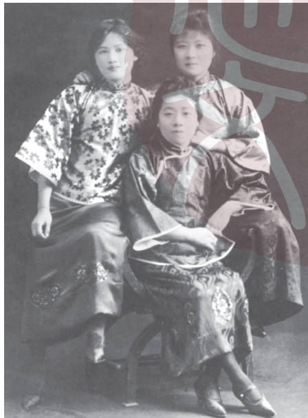
在衛斯理安女子學院學習時的宋慶齡、宋藹齡（中）、宋美齡（右）。

在這個學校裡，宋慶齡學習自勤奮，對哲學課程特別感興趣。她的文學及寫作水準較高，又熱心社會活動，因此她在課外活動中擔任了學院校刊《衛斯理安》(THE WESLEYAN)的文學編輯和哈里斯文學社的通信幹事，還曾充當過狄斯比斯戲劇俱樂部