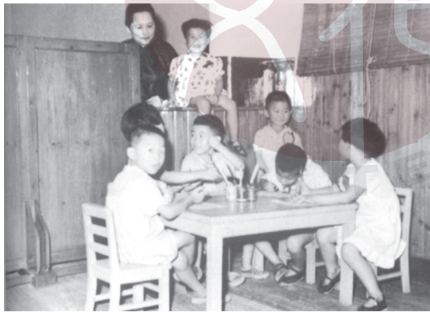
一九四七年，宋慶齡在中國福利基金會兒童福利站看望孩子們。

「這是一出深刻、動人的兒童劇，它不僅對兒童有很大的教育作用，同時也給予從事兒童教育者一個明確的啟示。」在她的堅定扶持下，四月十日在上海蘭心大劇院隆重公演。宋慶齡親自出席，並決定發售沒有固定票價的榮譽券，進行了募捐。