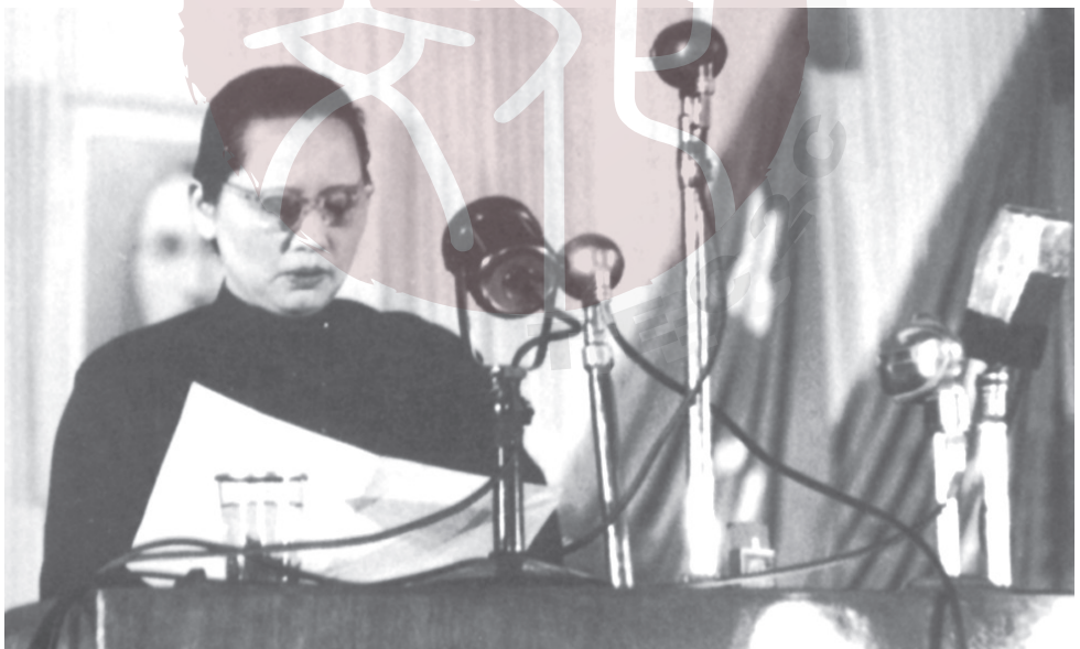
一九四九年九月二十一日至三十日，中國人民政治協商議第一屆全體會議在北京召開，宋慶齡出席會議並發表講話。