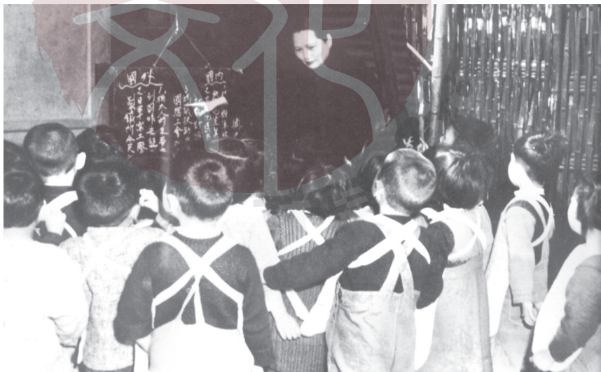
一九四七年，宋慶齡看望中國福利基金會兒童福利站識字班的孩子。