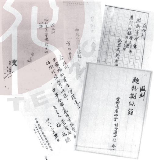
一九四七年，文化藝術界接受中國福利基金會捐助的部分收據。

在與「聯總」交涉過程中，宋慶齡還以兒童福利站的名義爭取「聯總」的救濟物資。這些物資除用於接濟貧苦兒童之外，一些解放區急需的物資，便轉交中共地下黨組織。另外，為救濟解放區兒童，在宋慶齡的關懷下，福利基金會通過與美國一個叫做「戰災兒童義養會」捐款機構的合作，成立了「中國戰災兒童義養會」。「義養會說明的對象是進步或可前進的團體，當時這些學校或兒童機構很少有旁的經費來源，通過了義養會的幫助，它們才得以度過了這個極端困難的時期。」 221