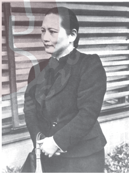
一九四九年，解放初期的宋慶齡。

旗冉冉升起時，她內心無比激動，眼裡閃爍著晶瑩的淚花。而看到天安門廣場正前方矗立著孫中山的巨幅畫像，她回想起孫中山在北京的奮鬥和逝世，更是心潮起伏，思緒萬千。她在上海的廣播講話中說：「我這次到北京時的感覺，和我在一九二五年時所經歷到的，真有天壤之別。」 251 那時候，這歷史的古城是各國帝國主義的基地，也是孫中山不幸逝世的地方。現在，這個城市變成了人民的講壇，人民在這裡發出聲震雲霄的洪大的呼聲。這呼聲向人們表明，中國人民將創造一個新的文明，這種新的文明不僅影響到每一個中國人，並且影響到世界上每一個人。這使宋慶齡感到無比自豪。