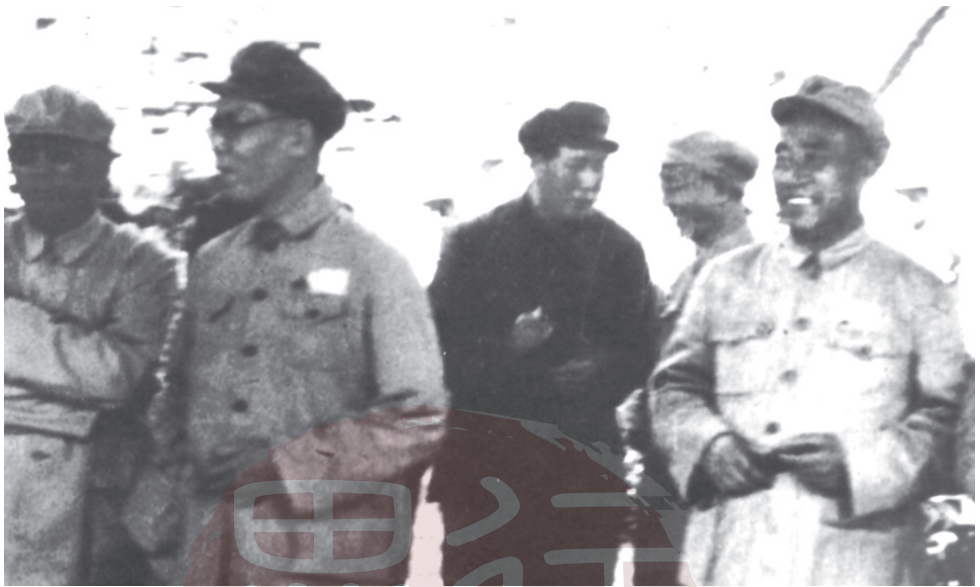
一九四九年八月二十八日，毛澤東、朱德、劉少奇、周恩來等在北京火車站迎候宋慶齡。