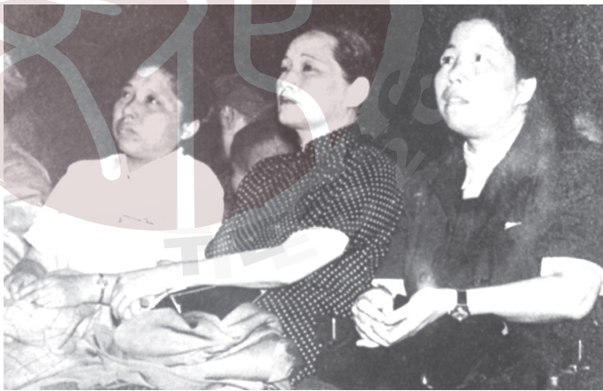
一九四九年六月三十日，宋慶齡由鄧穎超（右一）、廖夢醒（左一）陪同，出席上海市黨政軍民慶祝中國共產黨成立二十八周年大會。