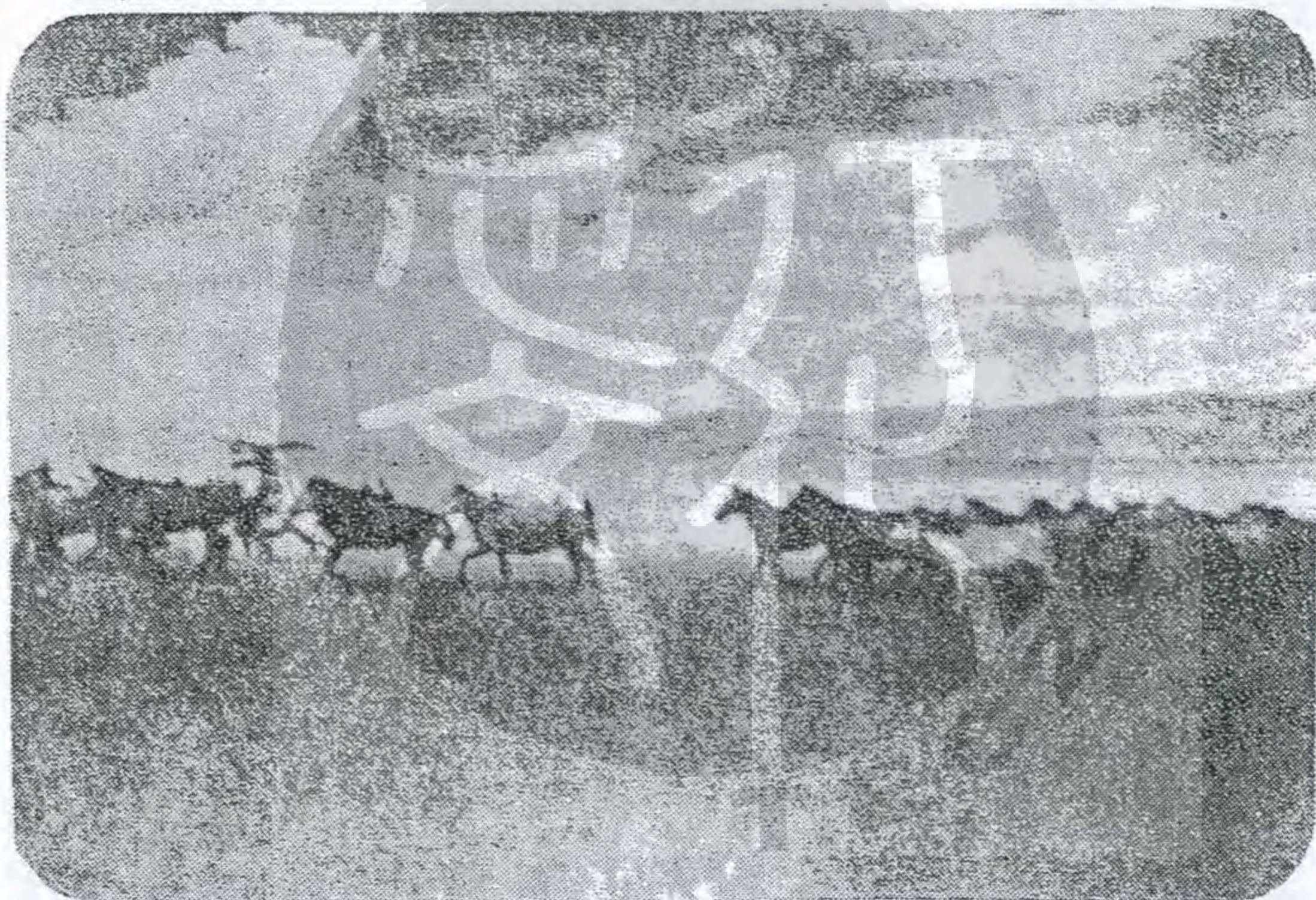
（上）青海並不產鹽，產鹽之處係上圖的察卡鹽池，是青海的一大富源。 （下）奔馳於青海大草原上的馬羣。