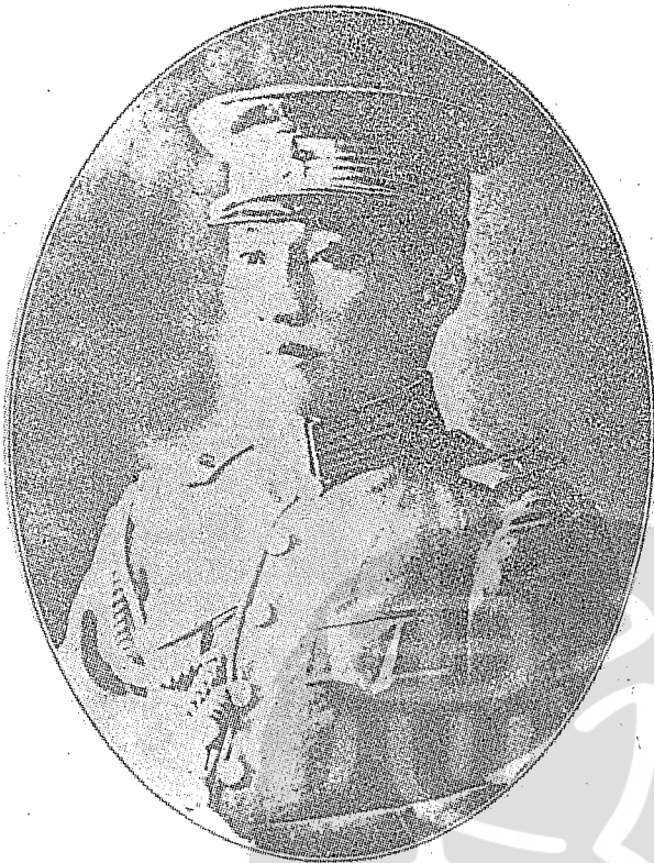
吳鐵城將軍早年任廣東省警務處長兼警衛軍司令時的照相。

足而三，執筆者多係大專名教授，為國內最具學術性的權威刊物。那時，「時代公論」由林時懋兄負責佐理發行總務，我和胡祥麟兄負責編輯任務並撰寫時評，後來楊公達主辦聯合國同志會編行「世界政治」，要我幫忙社務，因我和國民外交協會反侵略會負責人熟識，易於切取聯繫，那時印度尼赫魯來華訪問，我們三個民間團體，聯合歡迎辦得有聲有色，轟動一時，聯合國同志會編印的叢書也風行一時，到現在還可以作為國際政治方面重要參考典籍。