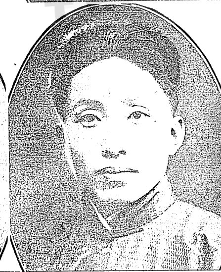
力行社的發起人：上右賀衷寒。上左周復。中右康澤。中左葉維。 下右蕭贊育。下左彭孟緝。（文見一二七頁）