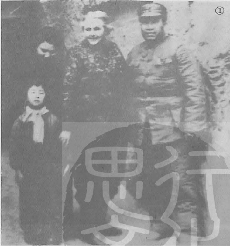
① 朱德（右）、康克清（左）夫婦與美人安娜·路易斯·斯特朗（中）在延安合影。 ② 右起：朱德、周恩來、黃琪翔夫婦、葉劍英、張群在南京合影。