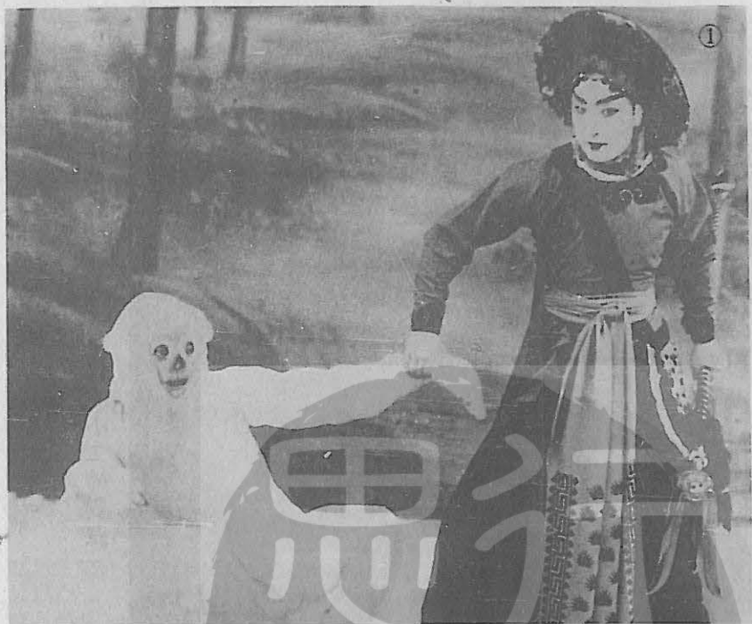
①尚小雲在「青城十九俠」中飾演呂靈姑。