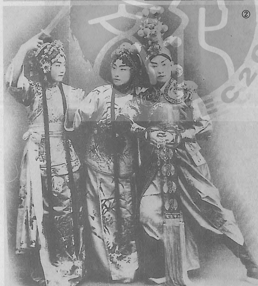
②尚小雲(中)在「虹霓關」中的劇照，左為程硯秋，右為梅蘭芳。