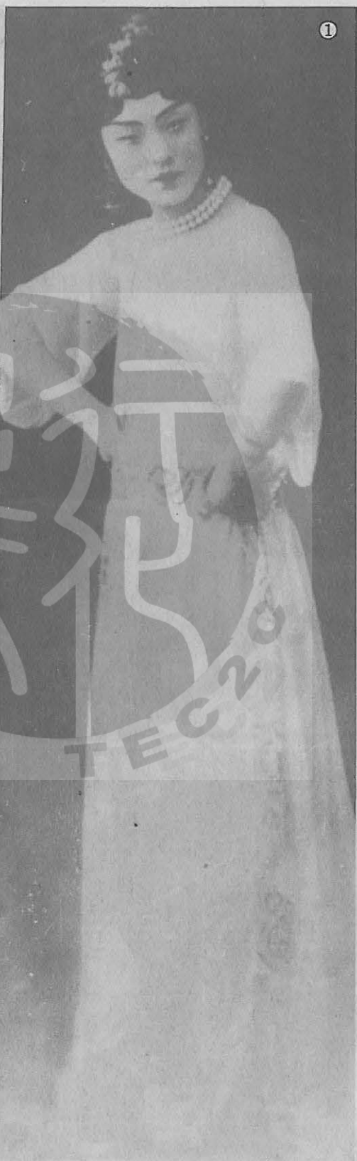
①尚小雲在「摩登伽女」中飾演吉鉢帝。 ②尚小雲在「北國佳人」中飾演小玉的劇照。