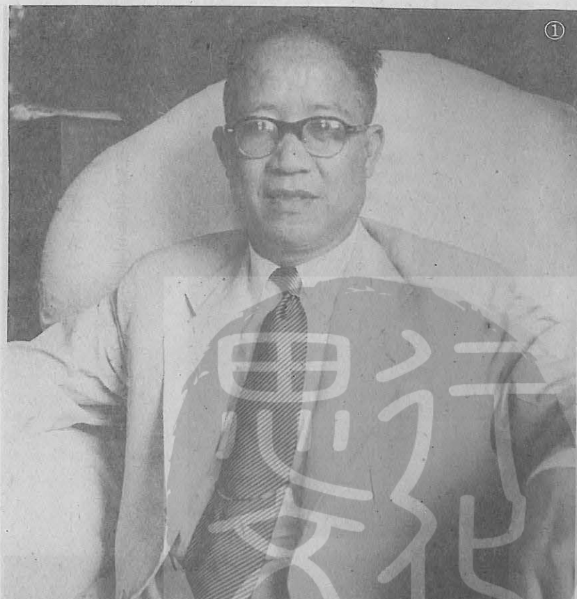
①尹仲容民國四十三年五月卅日任俞鴻鈞內閣經濟部長時的照 相。 ②尹仲容（左一）偕李國鼎（右一）民國四十八年在台北參觀 某汽車製造廠時留影。