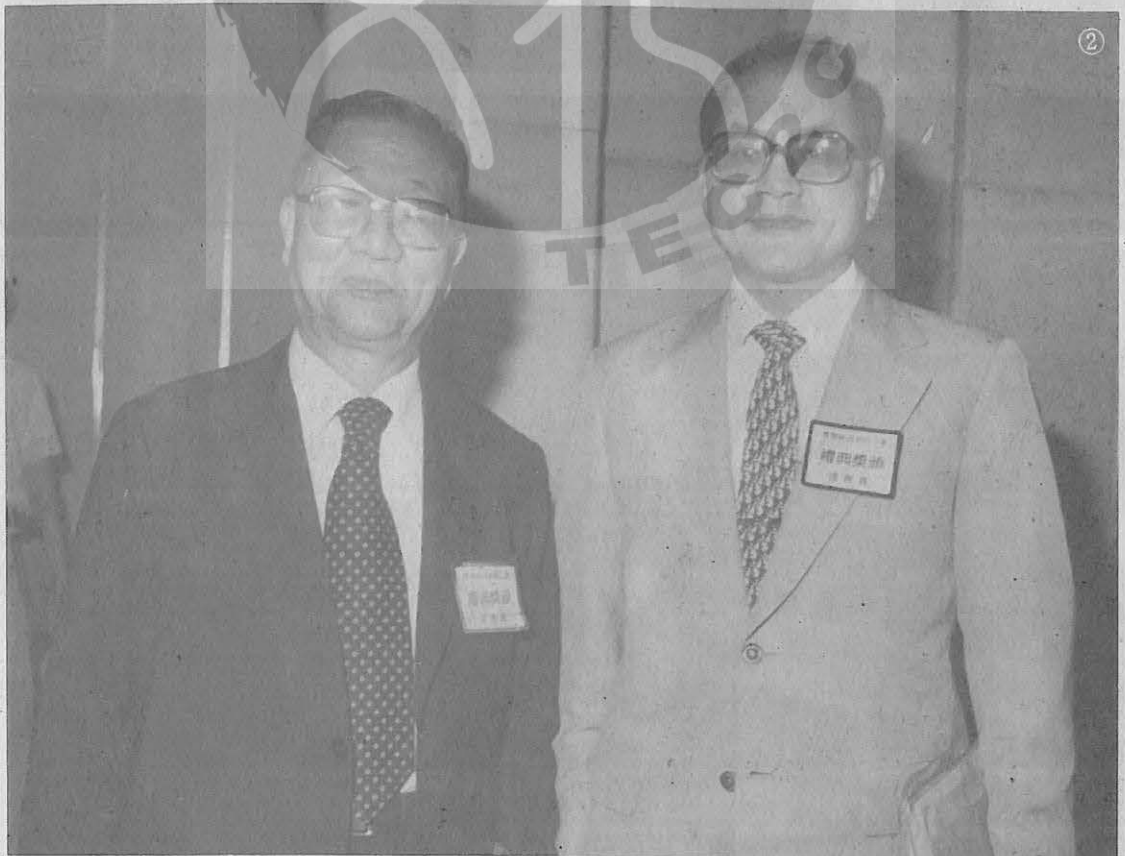
②作者（左）與農委會主委余玉賢（右）合影。