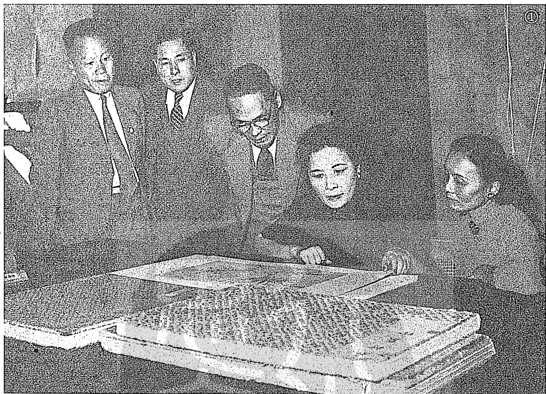
①杭立武（左二）與黃君璧（左三）陪同蔣宋美齡女士觀賞故宮名畫。