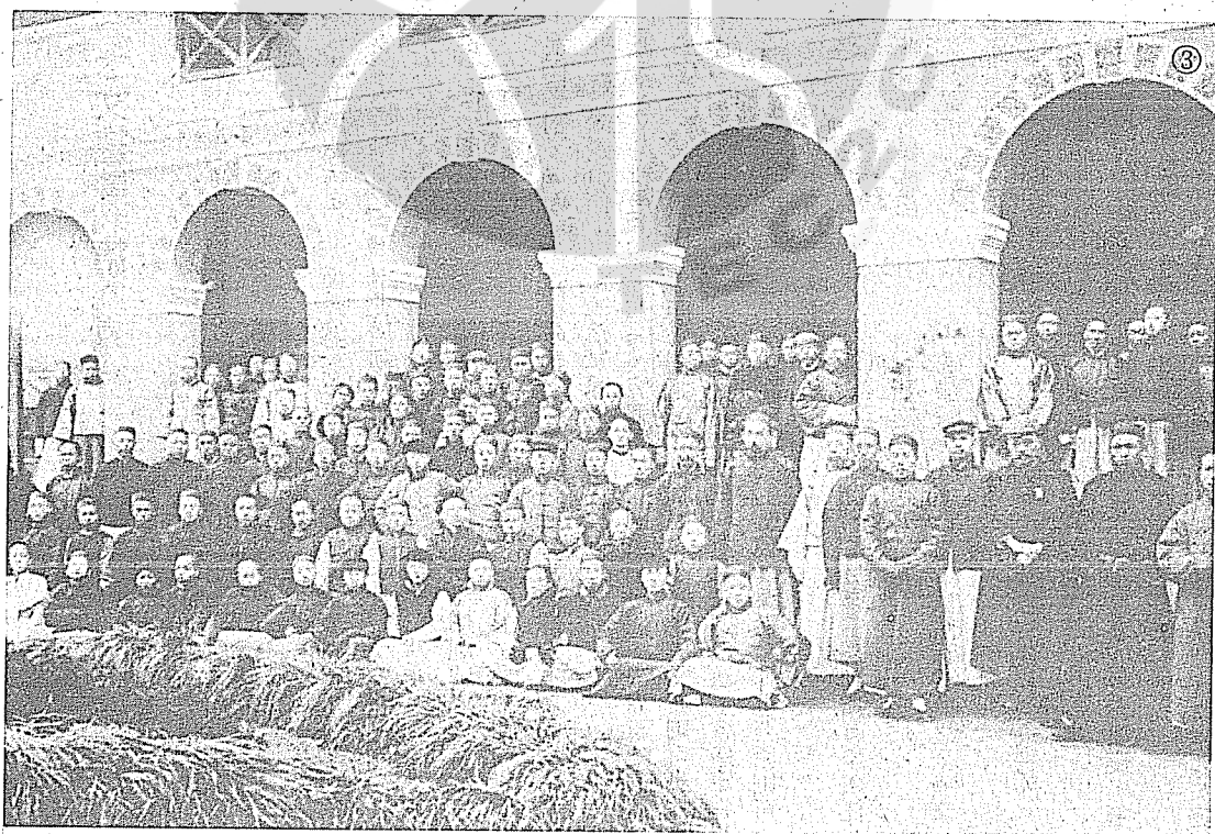
③黃宗仰（前排右一）、章太炎（右三）與愛國學社師生合影。