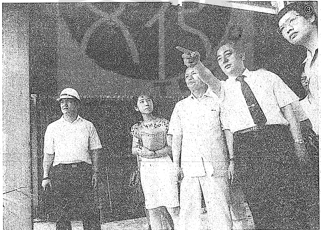
③黃大洲巡視市政中心新建大樓。