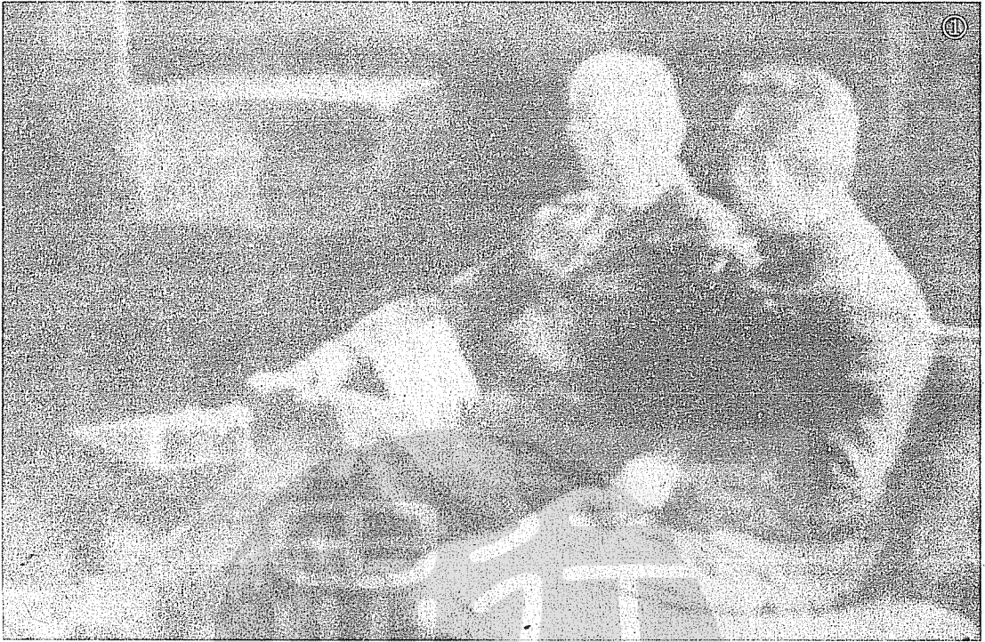
①孫立人（右）訪歐與歐洲聯軍統帥艾森豪晤談。