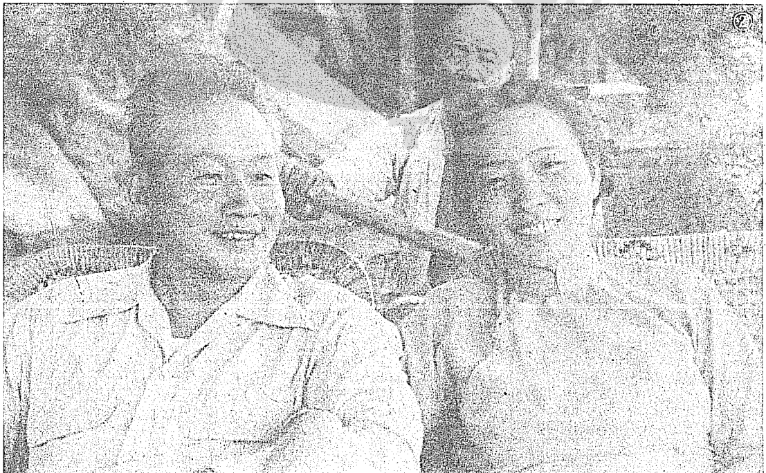
②孫立人與夫人張晶英女士在碧潭泛舟時留影。