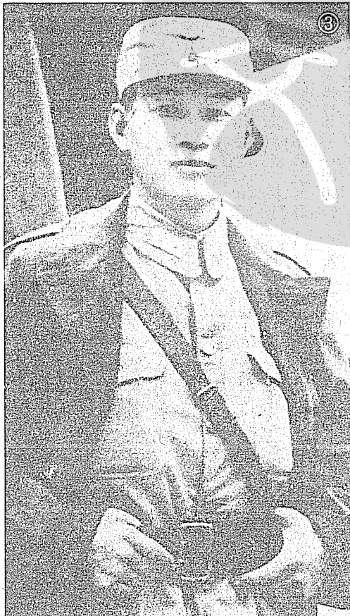
③民國34年孫立人啟程訪問歐洲戰場，在陪都重慶機場留影。