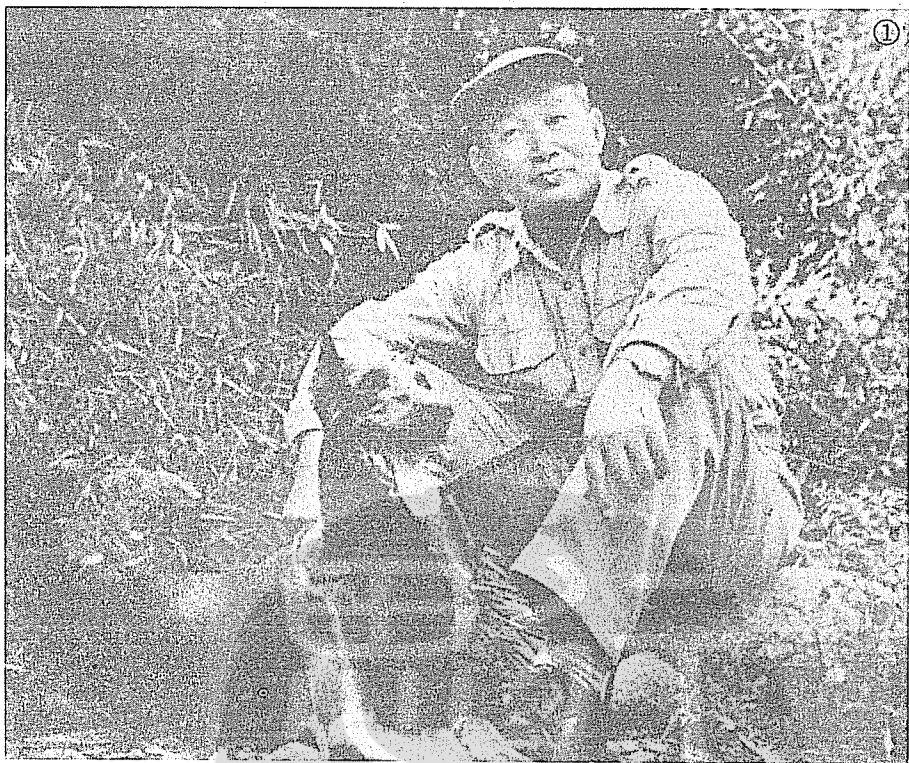
①孫立人公餘之暇，攜帶他喜愛的杜賓犬在山中打獵。

對眾人並有與生俱來的魅力，許多老兵們迄今仍以曾在新一軍，隸屬孫立人部下為榮。而孫立人落得被迫隱居數十年，未能充份發揮潛力，對國家作更大貢獻的原因；恐怕是受自視過高，不與同僚為伍，名位之心較重，在不順遂時，說話不知節制的原因吧！