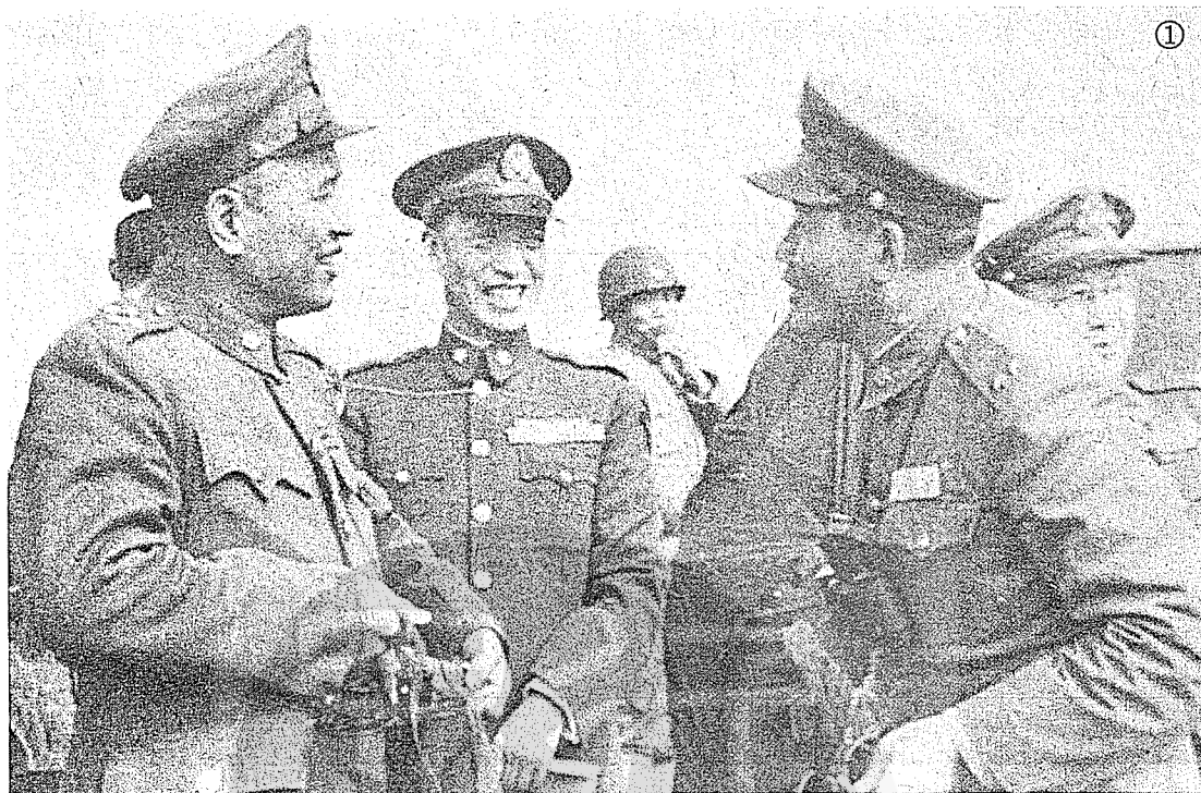
陳嘉驥「孫立人的是非功過」插圖（文見34頁）