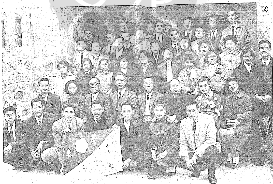
②邵鏡人教授（二排左三）民48年2月與崇基學院中文系師生合影。