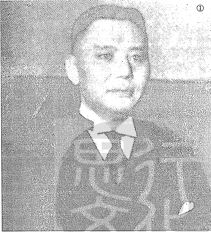
① 民國二十五年十月十日張群任行政院外交部長時的照相。