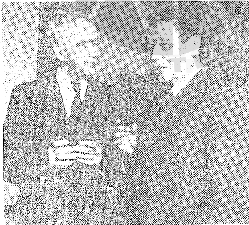
② 民國三十六年四月廿八日張群在南京任行政院長接受各國使節致賀，與美國駐華大使司徒雷登博士晤談時留影。