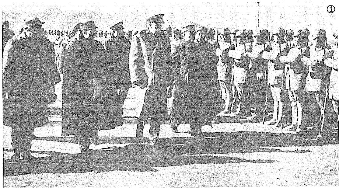
①聶榮臻（左一）陪同張治中（左二）馬歇爾（左三）鄭介民（左四）檢閱八路軍部隊的情景。