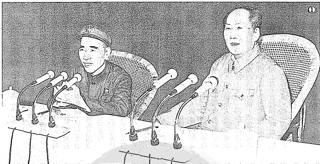
①毛澤東（右）與林彪（左）在中共九屆二中全會主席台上合影。