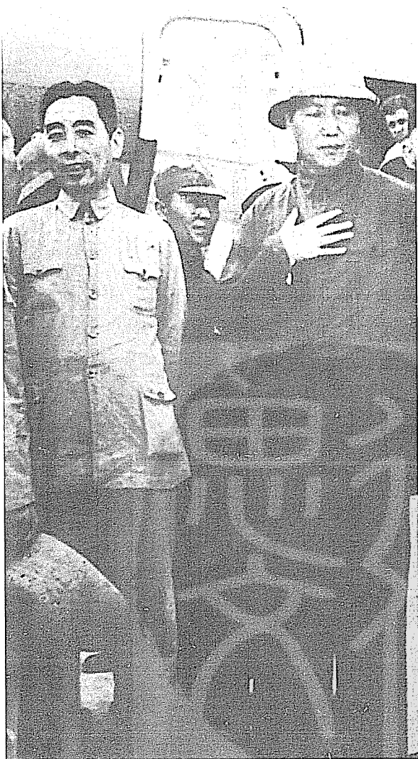
毛澤東（右）與周恩來（左）合影。

全國。有一次周恩來讓外交部給毛澤東呈送了《重要外事簡報》，毛澤東在簡報上批語寫道：「大事不報告，小事天天送，周恩來及其外交部，如不改正，必然變修正。」毛澤東把治國當成兒戲，常用順口溜批示文件，這段順口溜說明他對周恩來的痛恨。但此時的周恩來已經立於不敗之地。可惜的是周恩來已診斷出癌症。