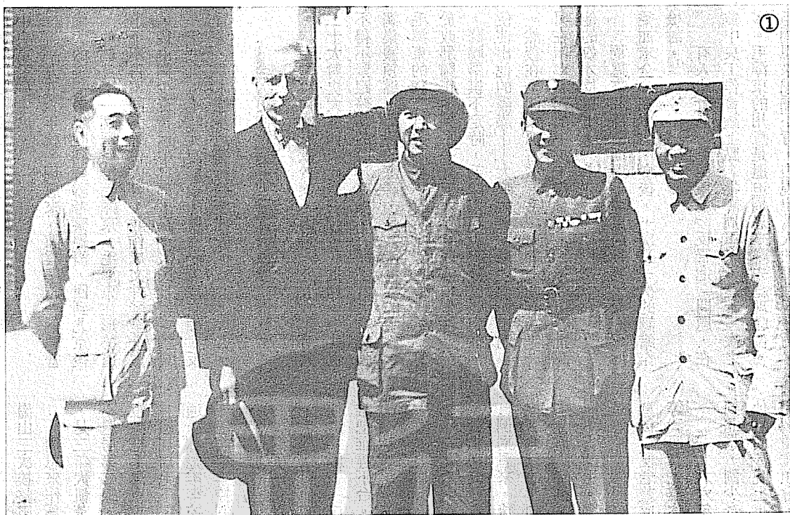
①左起：周恩來、赫爾利、毛澤東、張治中、朱德一九四五年在美軍駐延安觀察組門前留影。