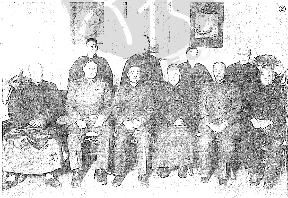
② 左二起：孫連仲、李宗仁、張繼、鹿鍾麟、態斌早年與河北士紳合影。