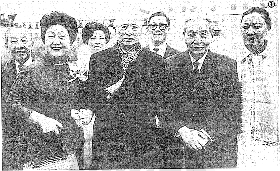
①張群（右二）與顧維鈞夫婦合影，左為魏道明夫人。