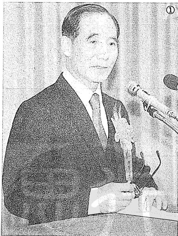
① 鄭為元講演時的神情。

術制度，辦理教練、裁判講習，提升專業水準。另外，他又提出三化政策，即行政制度化、訓練科學化、場地標準化。這些被體育界視為高瞻遠矚的做法，目前都已是體育界人士一致努力的目標。而體育辦公大樓，經多年興工，已於民國八十二年八月十四日落成，巍巍華廈，光彩奪目。體育界本想邀這位催生者參與落成盛典，可惜他已辭世，但他的恩澤，卻常留在體育界人士的心靈深處。