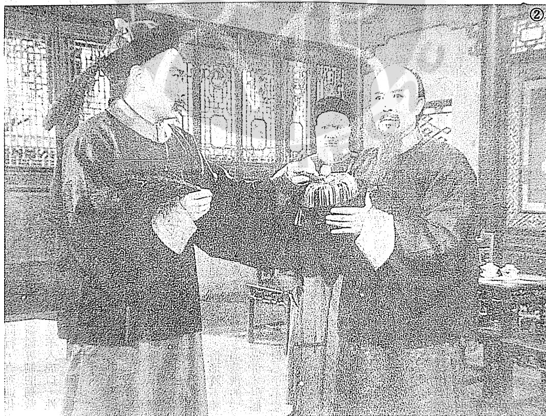
②趙丹在電影片中飾演欽差大臣林則徐。