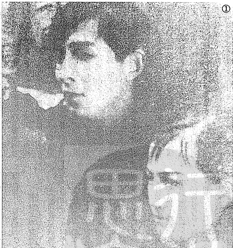
① 趙丹與周璇，一九三七年趙飾「馬路天使」中的小陳，周璇飾小紅。