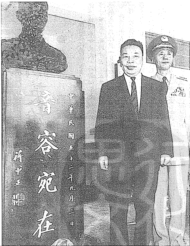
蔣經國(右二)在陳懷生紀念銅像前留影。

U2高空偵察機，是美國洛克希德飛機的新出品，裝有單噴射發動機，兩翼修長而薄，為了減輕飛機的重量，滑行的輪子既小且少。飛行速度，接近音速，爬昇穩定超過六萬呎，最高可到十萬呎，不分晝夜寒暑，不怕風雨雲霧，可全天候作業，續航力超過九小時，可以續航三千多哩，儀器設備精良，在七萬呎高空，可以清晰地照出地面汽車活動情況。這樣精密優良的飛機，只有技藝超群，訓練嫻熟的飛行員，才有能力駕駛。(未完待續)