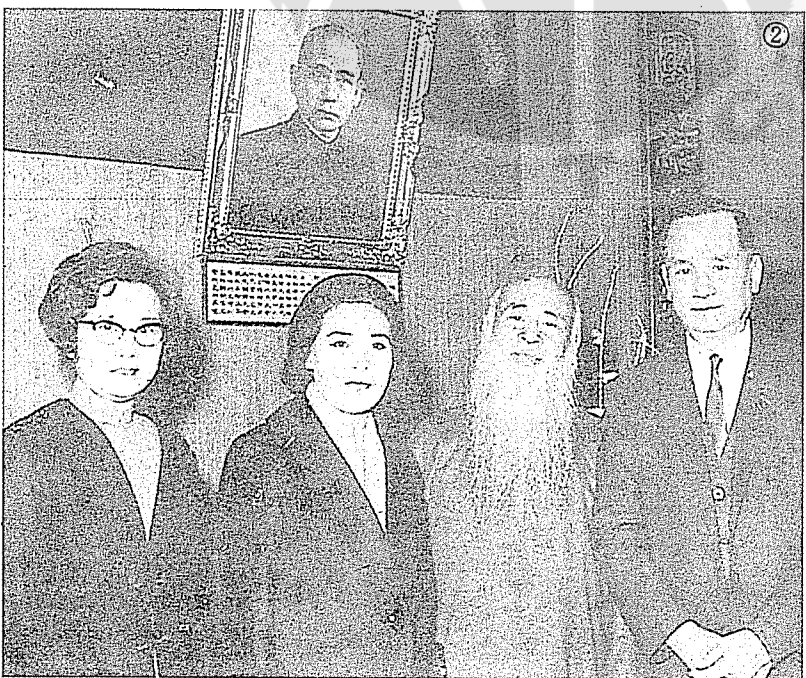
②高信夫婦（右、左）與張大千夫婦（中）合影。