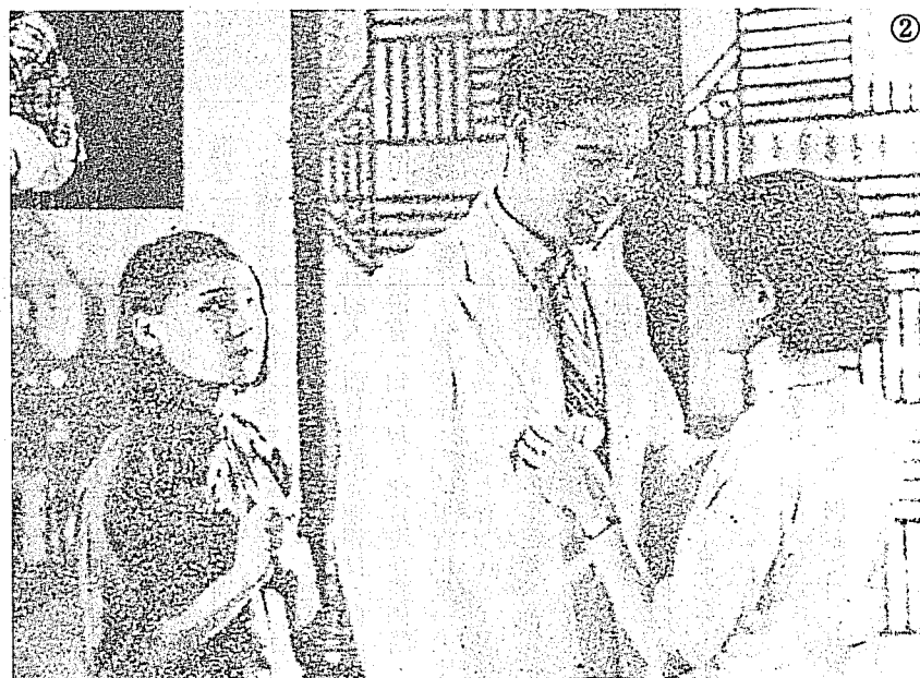
② 陳燕燕（左）在電影「三個摩登女性」中的劇照。