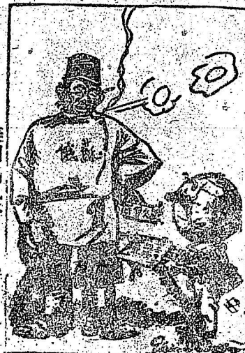
美國 Baltimore Sun