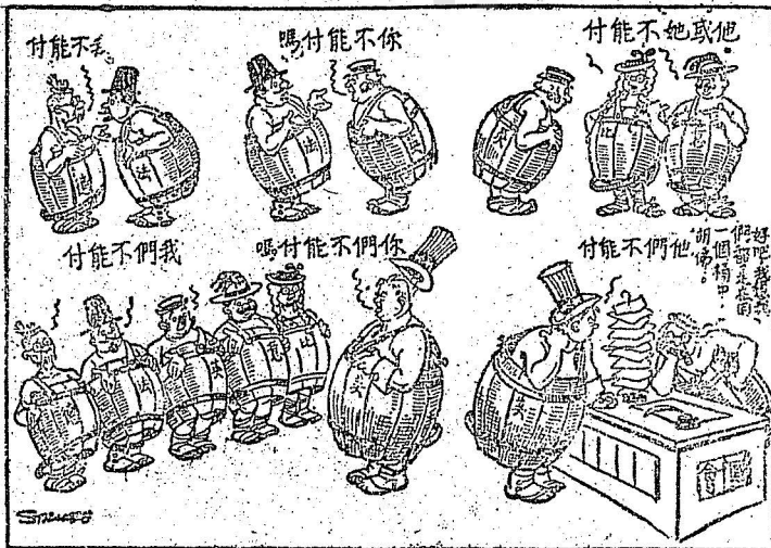
英國 The Daily Express