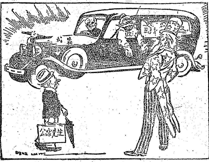
英國Glasgow Record 報