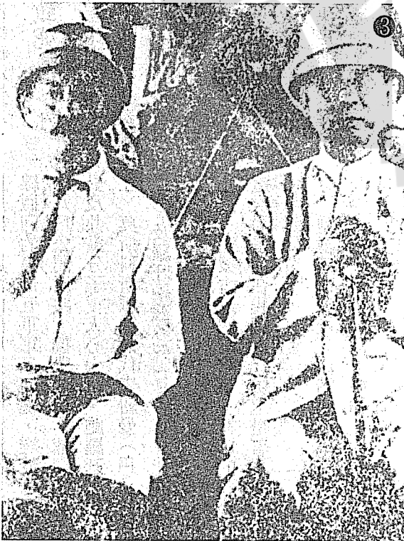
① 孫中山的政治顧問鮑羅廷。 ② 鮑羅廷（左）與孫中山合影。