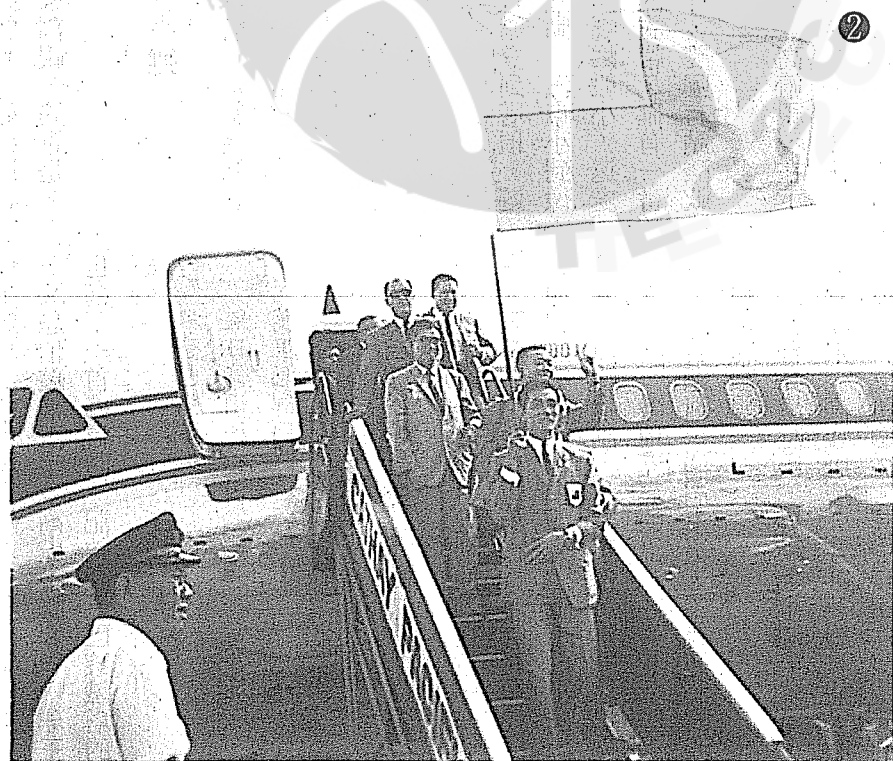
①球王李惠堂（立）與先總統蔣中正合影。 ②一九六五年九月九日李惠堂任中華足球代表隊教練時與隊員們回國在機場合影。