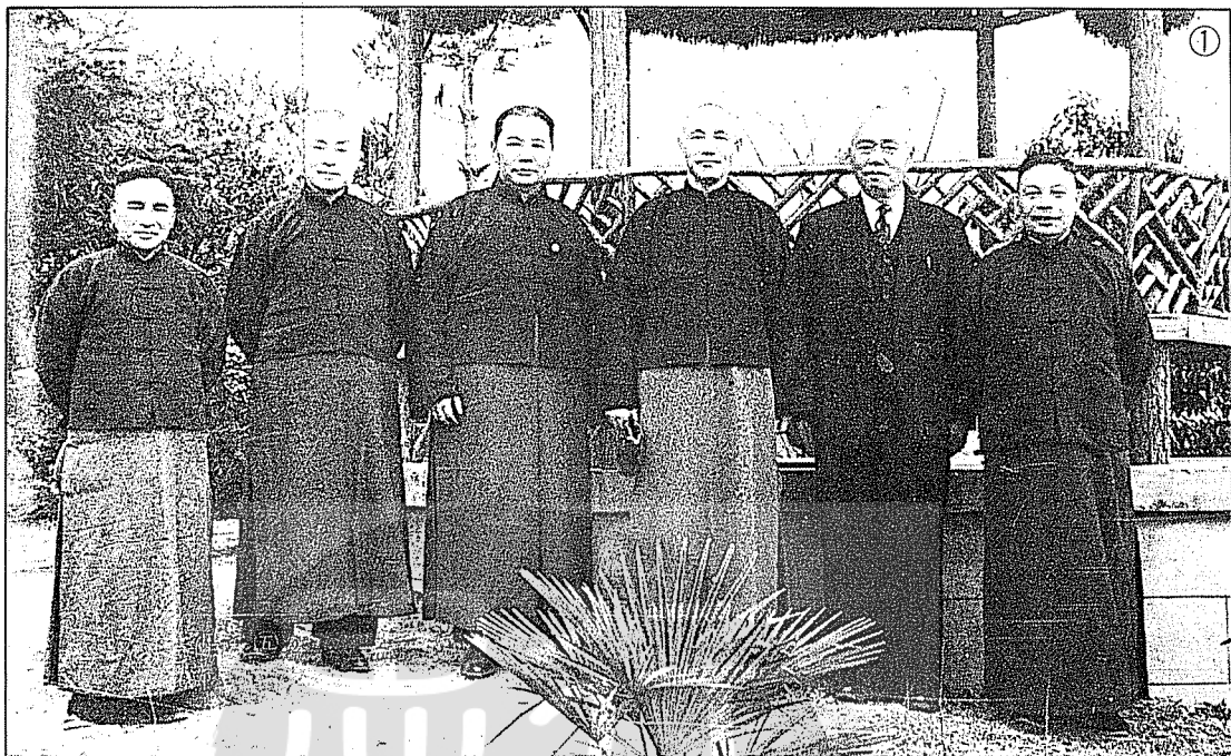
①民38年春節蔣公介石與張羣(左三)陳立夫(左二)鄭彥棻(左)蔣經國先生(右)施季言(右二)合影。