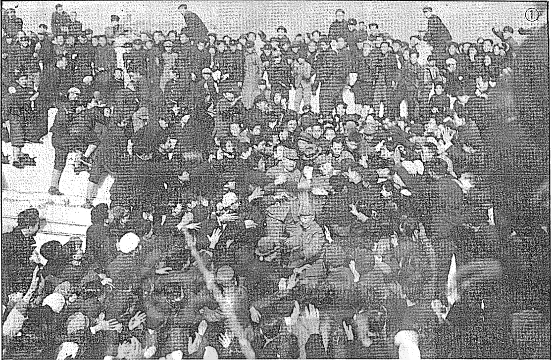
①民34年12月17日北平太和殿廣場上學生爭相與蔣公(正中着上將服右手戴白手套)握手。左側戴呢帽者為鄭彥棻。②39年8月5日蔣公主持中央常會，右為秘書長鄭彥棻。