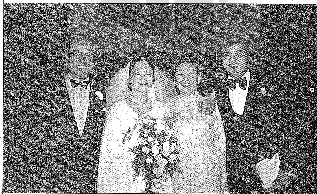
②胡旭光將軍夫婦與次公子及兒媳合影。(文見109及111頁)