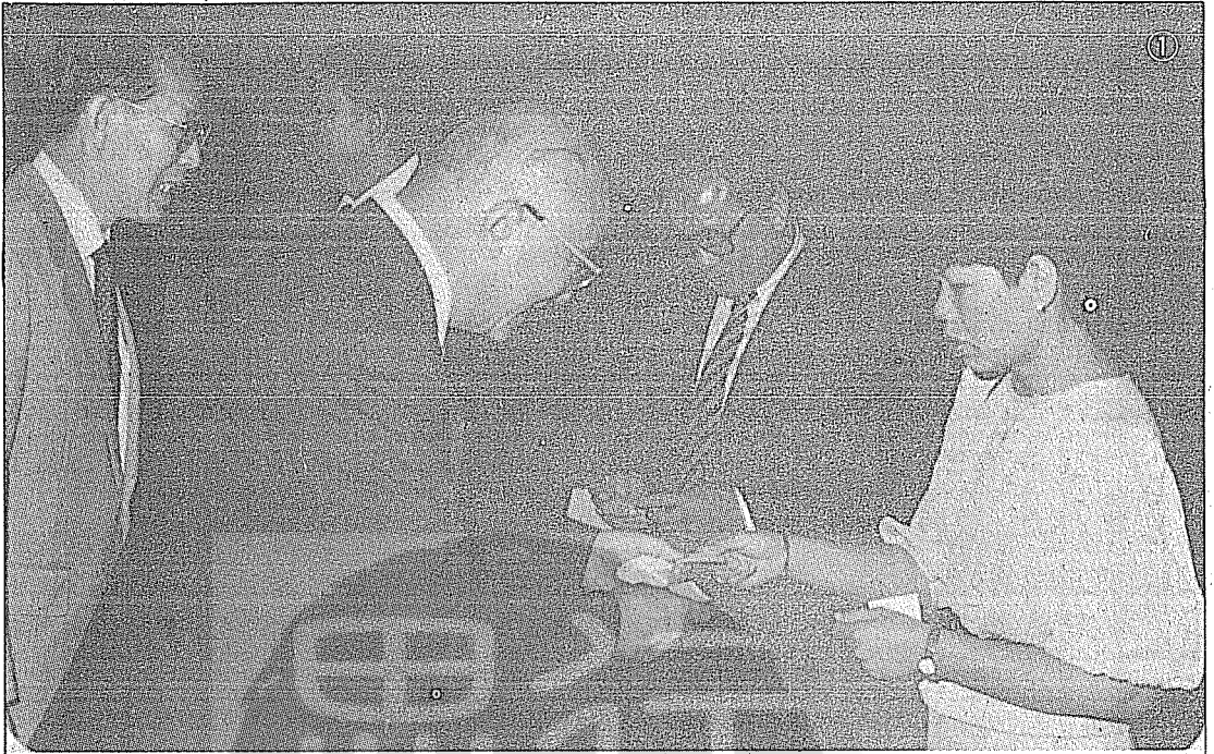
①王爵榮與泰國國會議員蘇拉攀(右二)晤談。