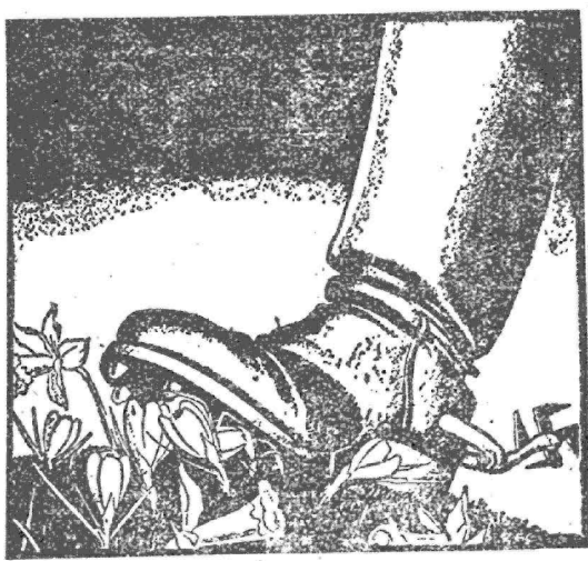
納粹鐵蹄下的歐陸。

吾人現所期者，即蘇聯人民正保衛其國土，而蘇聯之首領，並向大眾籲請，竭力抗戰。希特勒為罪惡之妖魔，對於晚血與剝掠，貪婪無厭。雖將全歐置於其足下，亦不以為足。彼現又擬屠殺與摧殘蘇聯與亞洲。吾人與其餘世界文明