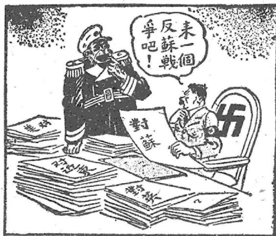
希特勒對英對美沒有辦法，就發瘋地來一個反蘇戰爭了。

惟無論何線，兩軍的主力，似尙未發生正面的決戰，至少就目前的資料，尙屬前哨戰的性質，不足決定戰事終局的勝負。