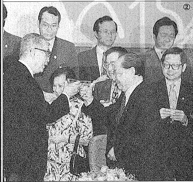
②辜振甫（左）與汪道涵（右二）會談後相互敬酒碰杯的情景。

能浮現。 總括來說，大陸經濟成長快速，雖然有通貨膨脹，國營企業虧損，失業嚴重等的問題，但其經濟力一直朝好的方向發展，經濟轉好後，政治也非改革不可。但是外界有些人認為中共會動亂，這是大錯特錯，中共政局不會大變，小變的事，時時都在發生，積小成大，就會漸失本來的面目了。 中共新一代領導人如朱鎔基、喬石、李瑞環都是思想比較開放的人物，鄧死後，開放的步子可能會加大、加快。但中共目前的體制，缺乏民主監督，以致幹部腐化問題嚴重，靠嚴刑峻罰遏止。但刑罰僅止於省級以下幹部，「刑不到上大夫」，有句順口溜「大官倒做報告、中官倒做檢討、小官倒做監牢」，所以中共他日如果滅亡，必是亡在幹部貪污腐化，而不是亡於民運人士或台灣的三民主義。