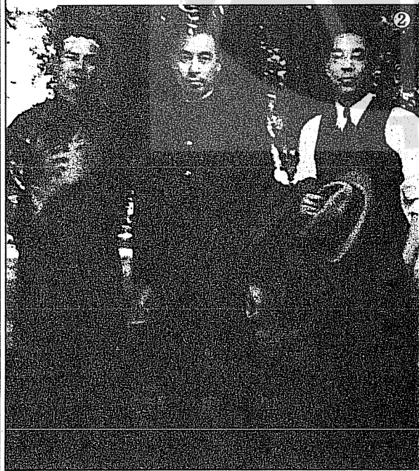
②周恩來(中)與張沖(右)葉劍英(左)合影。