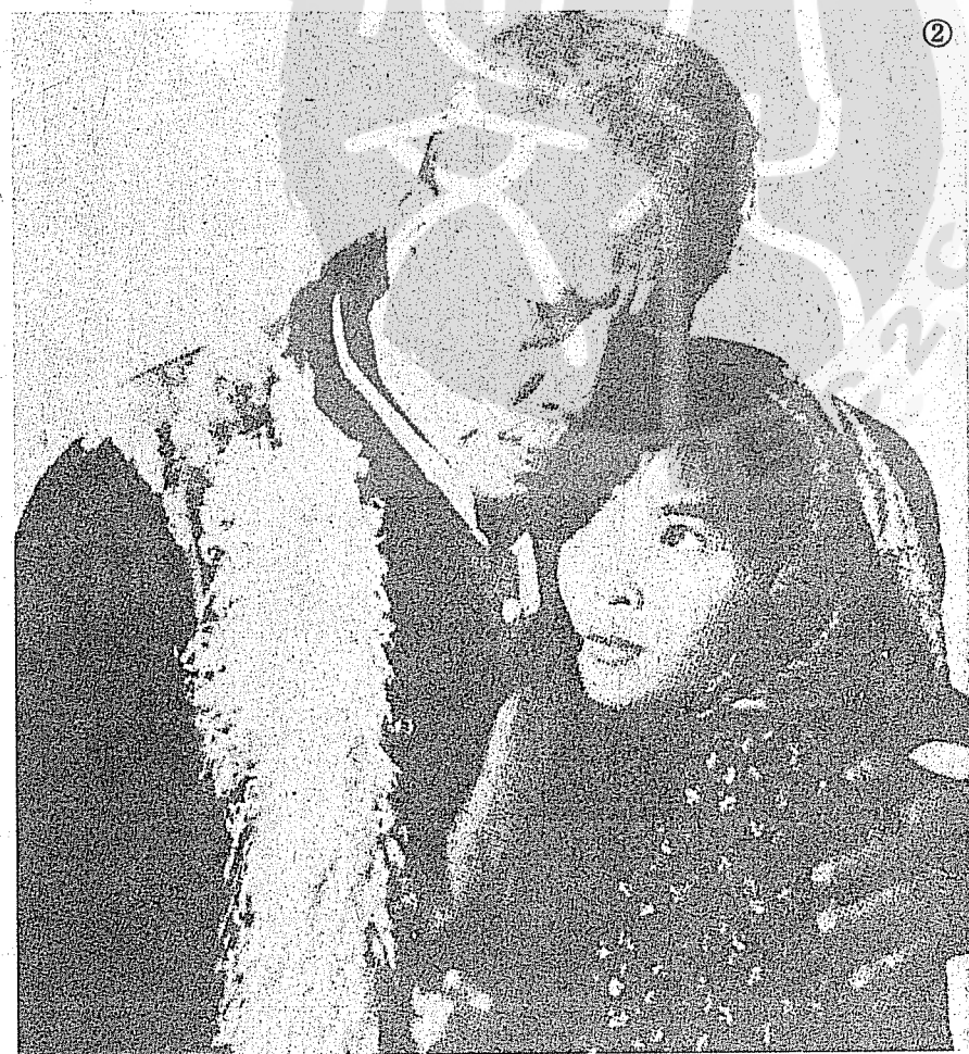
②王引（左）在電影「孤兒流浪記」中的劇照，右為蕭芳芳。