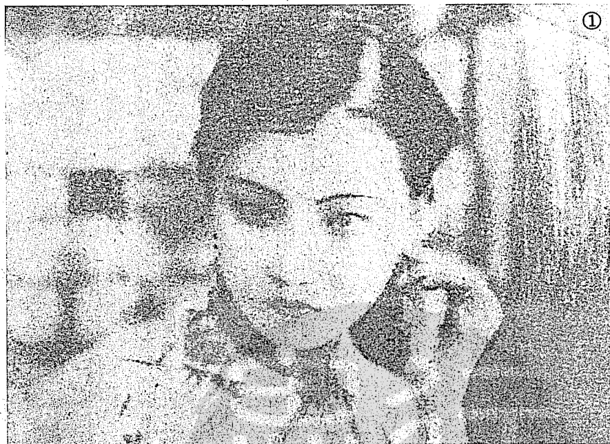
①袁美雲在影片「小女伶」中的扮相。