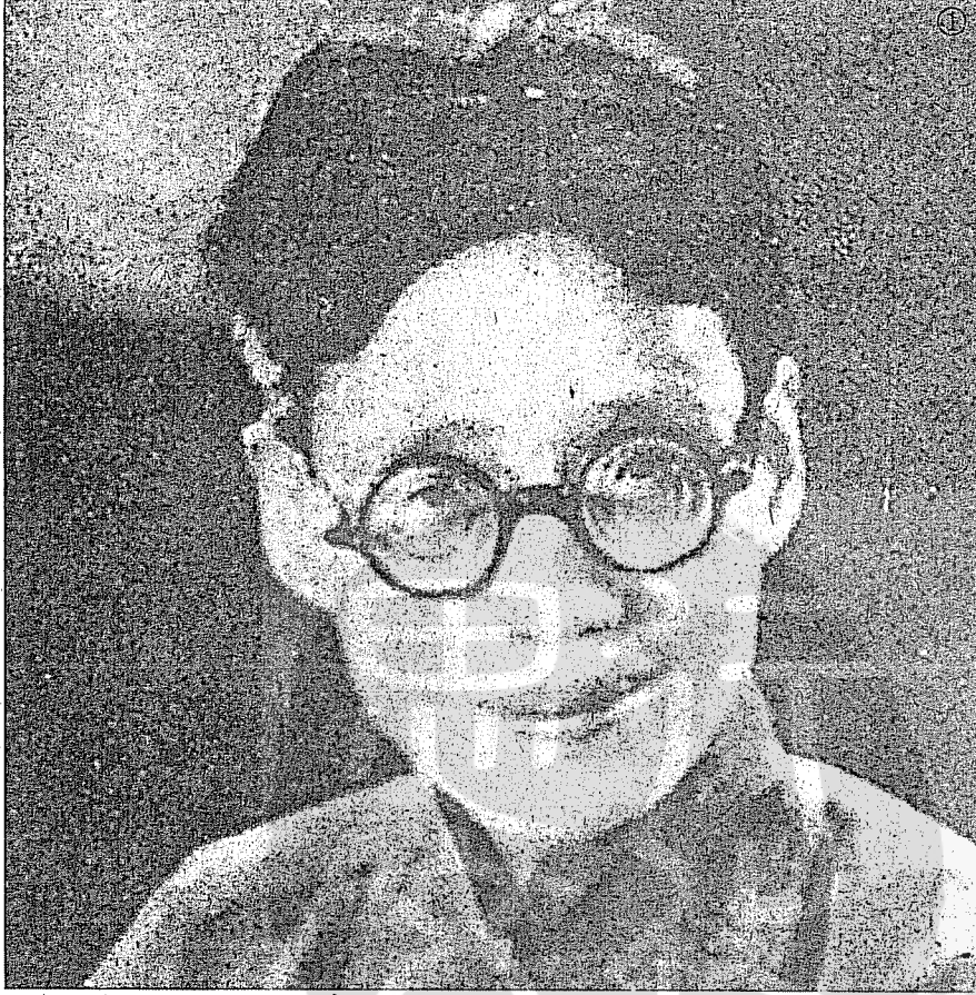
②影星胡蝶（右）早年在百代公司錄音時的神情。 ①烟土行小開明星影片公司創辦人鄭正秋。