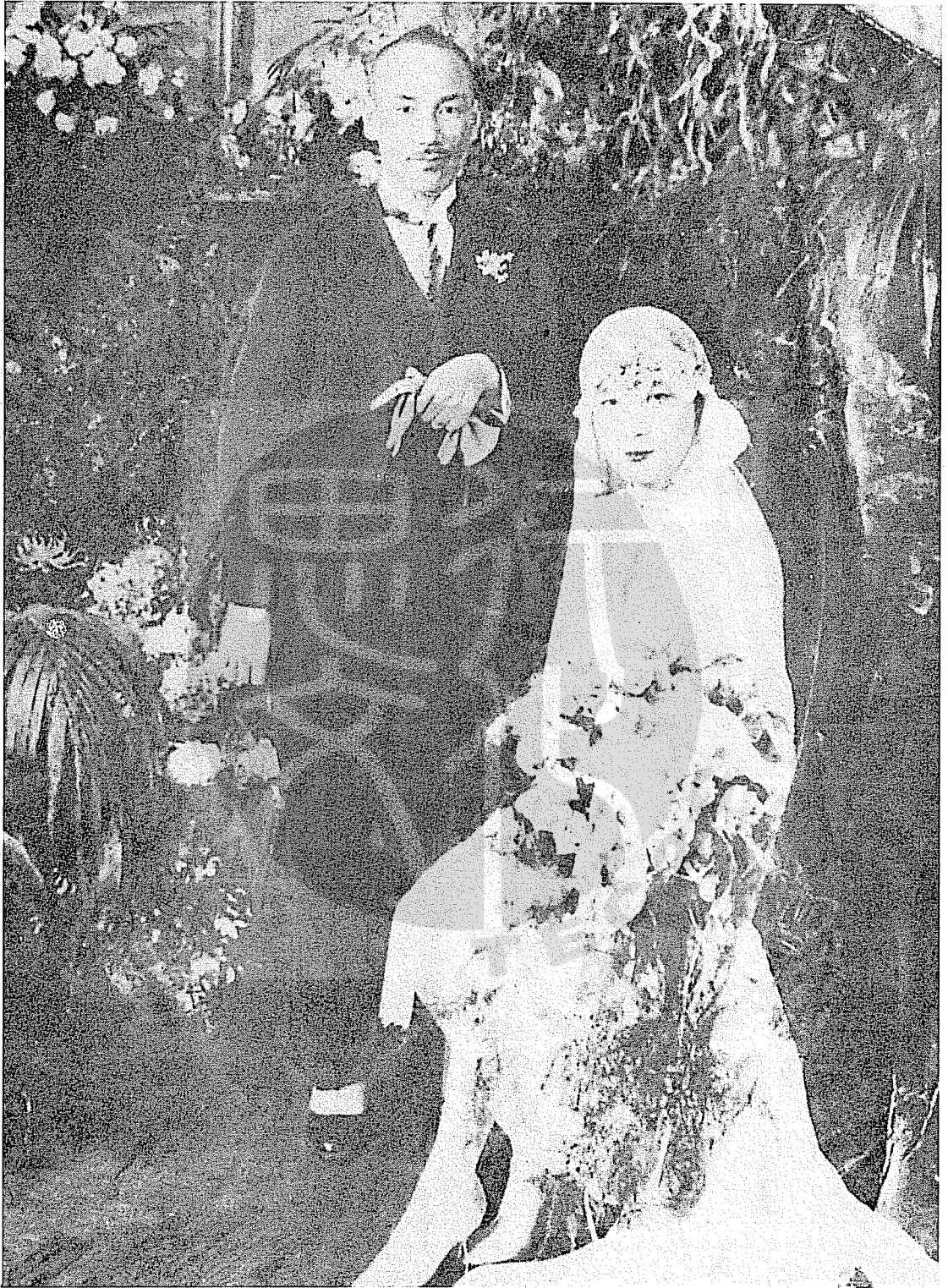
蔣介石1927年9月29日在申報刊登啟事說明民國10年與原配毛氏離婚，與其他二氏無婚約，已脫離關係後於1927年12月1日與宋美齡女士在上海結婚。