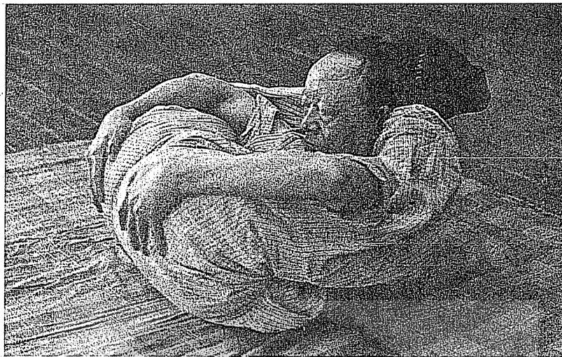
賀衷寒瑜珈示範表演「蛇盤蛋」圖照。

驗與心得之結晶，編印發行，頗獲好評，至今仍為研究交通管理者列入必讀之參考書。 民國四十三年行政院改組，賀氏辭交通部長，出任總統府國策顧問。民國五十四年應邀出任行政院政務委員。至民國六十年因