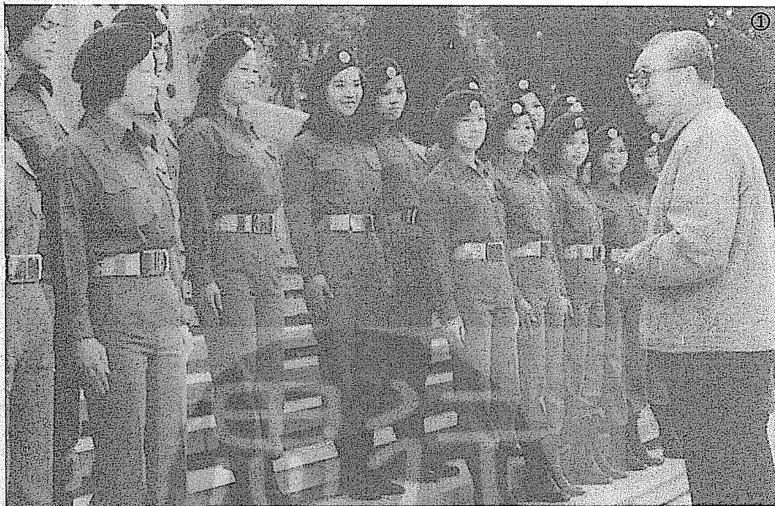
① 蔣經國（右）巡視金門時與金門女子自衛隊員合影。