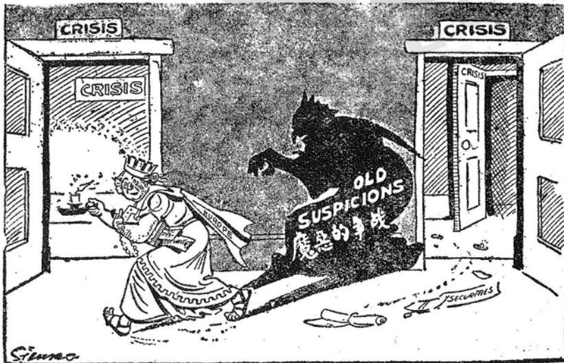
在戰神威脅下的歐洲。

凡今日在會諸君無一能對國聯大會召集之環境，稍具欣慰之思者，此際人人咸感覺悲痛，為國聯各會員國與國聯仍為一團體之利益計，此種事實，願予忍受。就意阿爭案中實施之制裁而論，國聯會員國已共同實施某種經濟與財政計畫矣；此項計畫之本身，並非未獲效果，惟衆所希望運用此項計畫之條件，未見實現，阿比西尼亞軍事與地方情勢之變化，實使吾人臻於實行之制裁不能挽轉該國事變之地步。如英政府確有理由相信維持現有之制裁，甚至另增其他經濟計畫，能以恢復阿比西尼亞之地位，祇須國聯其他會員國允實施，則英政府準備主張此種政策，惟英政府今覺絕不能抱此信念，吾人之意，唯軍事制裁始能收到效果，在目前之世界狀態中，余不敢信此種軍事行動能視為有可能性，今不得不承認現實，目前實行之制裁，實繼續進行，實無所利。英政府且以為此次國聯大會會議無論如何，不得承認意大利之佔領阿比西尼亞，再如大局之現實有急遽之變化，影響吾人對此計畫所決定之態度，則就吾人之判斷，決不能因以變更去秋國聯五十會員國對意國行動所表示之