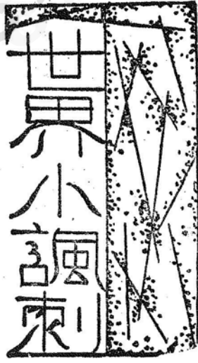
走向滅亡路上的日本。

日午後五時開會，先由英國外相艾登，以行政院主席資格擔任臨時主席，將本屆大會主席即捷克總統貝奈斯辭職書提出宣讀。當由出席各國代表選舉新主席，結果比國總理齊蘭在五十一票中，獲得四十七票當選。旋即就席，並發表演說將國際時局概況敘述一遍，謂今日乃國聯成立以來之緊要關頭，其所處地位至爲困難，「但余仍信賴各國對於本國之願望及感覺不滿之處，當能加以抑制，而以世界和平之偉大事業爲先也。」至是齊蘭乃將意國外長齊亞諾昨日發來備忘錄，提出宣讀，內稱：