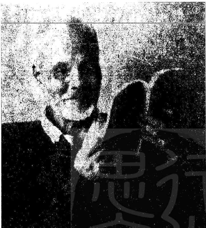
① 一代詞宗夏承燾晚年的照相。

夏承燾的婚姻甚有趣。他初戀的對象是他鄰居少女，他放學回來，常見這女孩子在門口等他。她是嘉善人，在她跟妹子一起回嘉善時，承燾正好同船到上海，她叫妹子約承燾到她房艙裡話