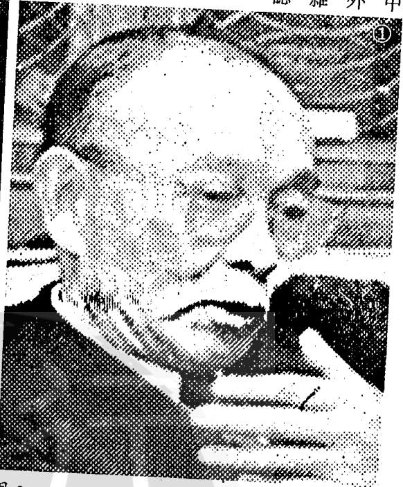
①幽默大師林語堂博士一九六二年的照相。