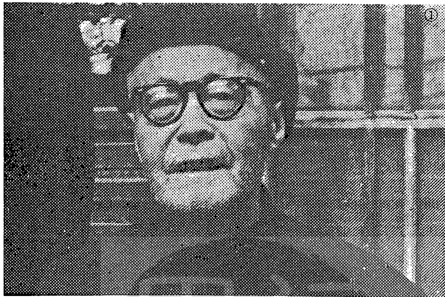
①顧頡剛晚年的照相。