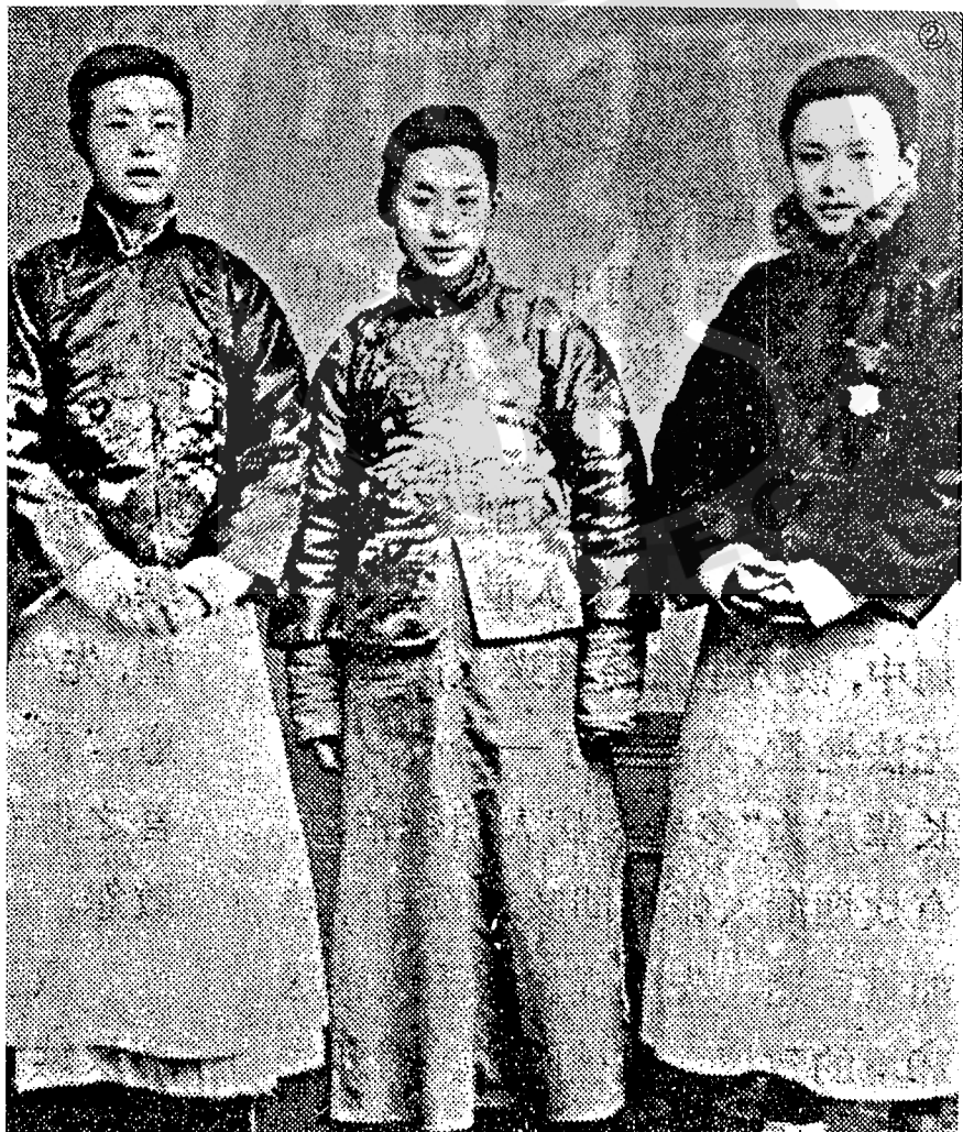
②顧頡剛（左）中學時代與同窗好友合影，右為：王伯祥、中為葉聖陶。