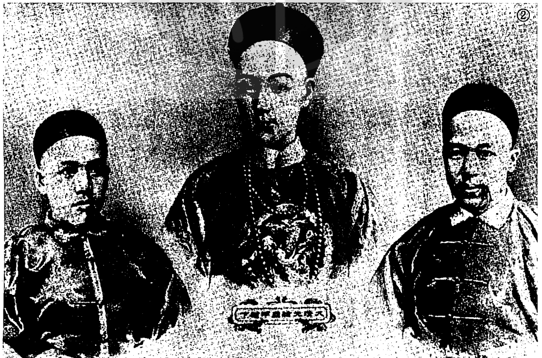
②戊戌政變三主角右起：康有為、光緒皇帝載湉、梁啟超合影。