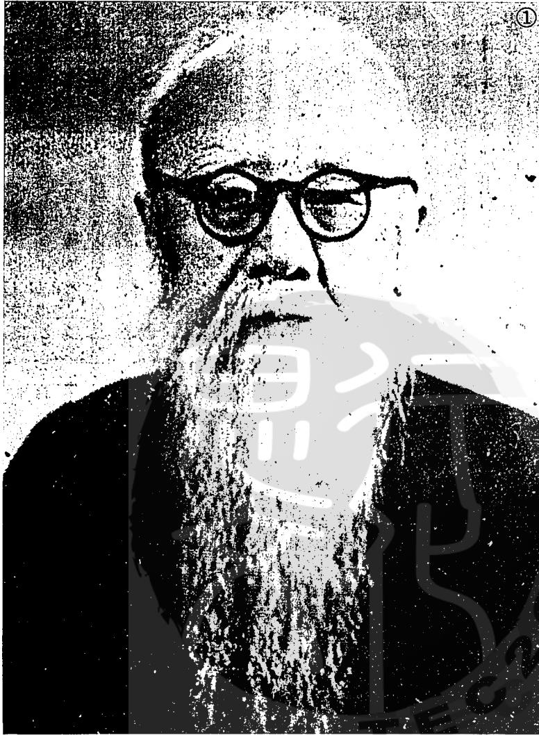
① 中國唯一的理學家馬一浮教授。