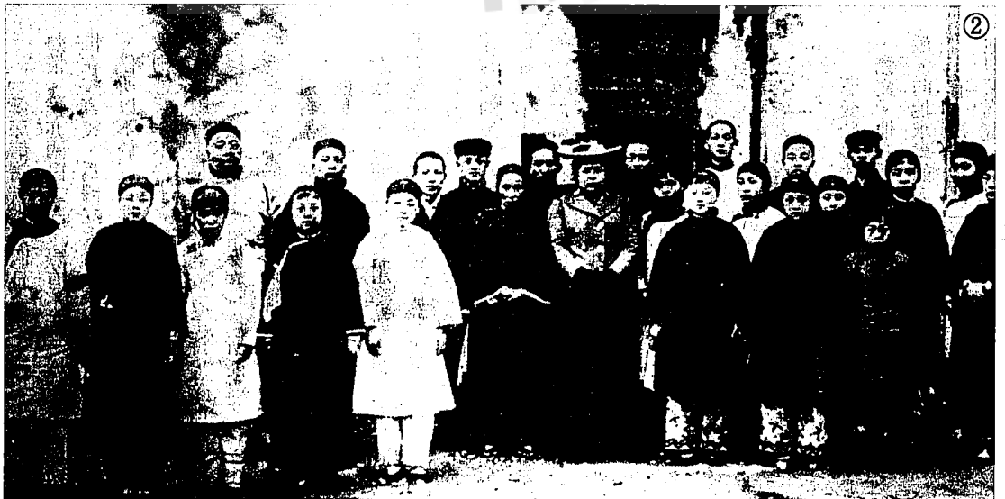
② 蔡元培（後排左五）與愛國女校的學員們合影。