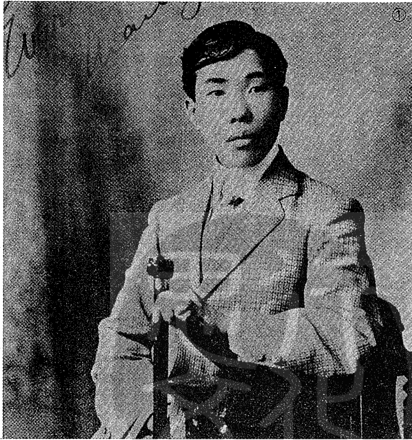
①少年俊逸的蘇曼殊大師。