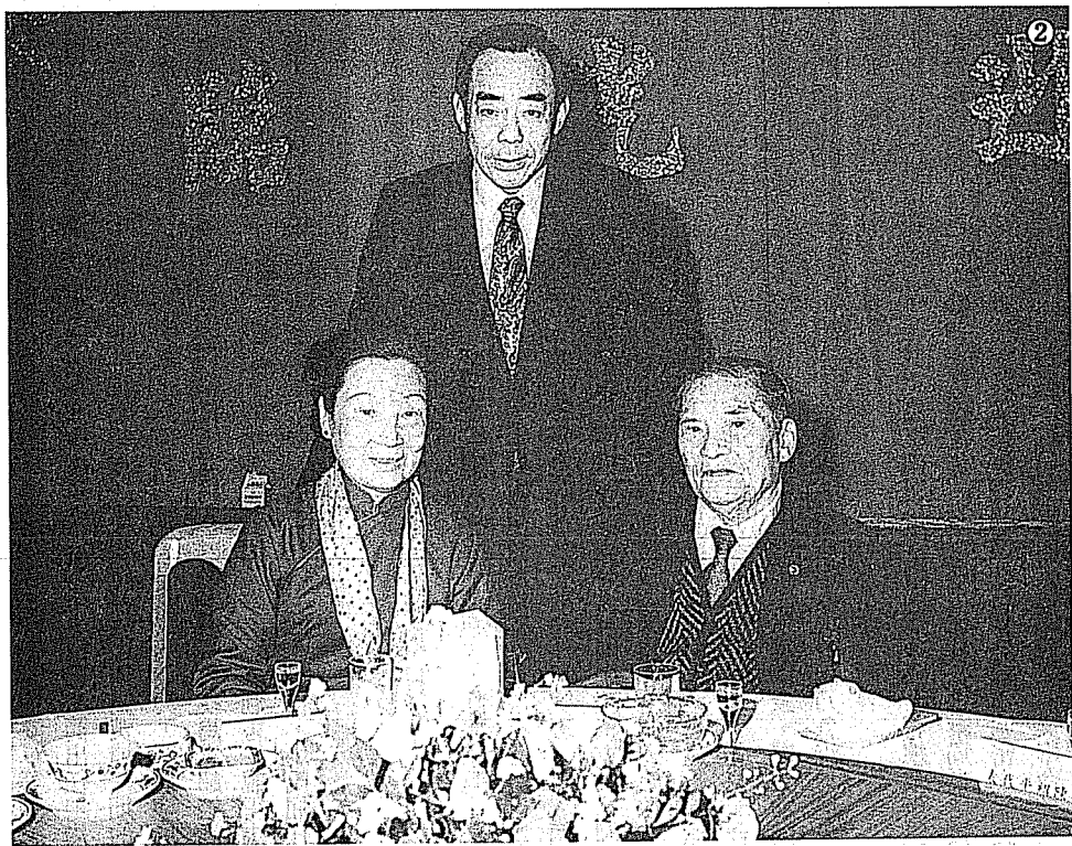
② 吉章簡生前偕夫人與國際問題專家殷宗文將軍合影。