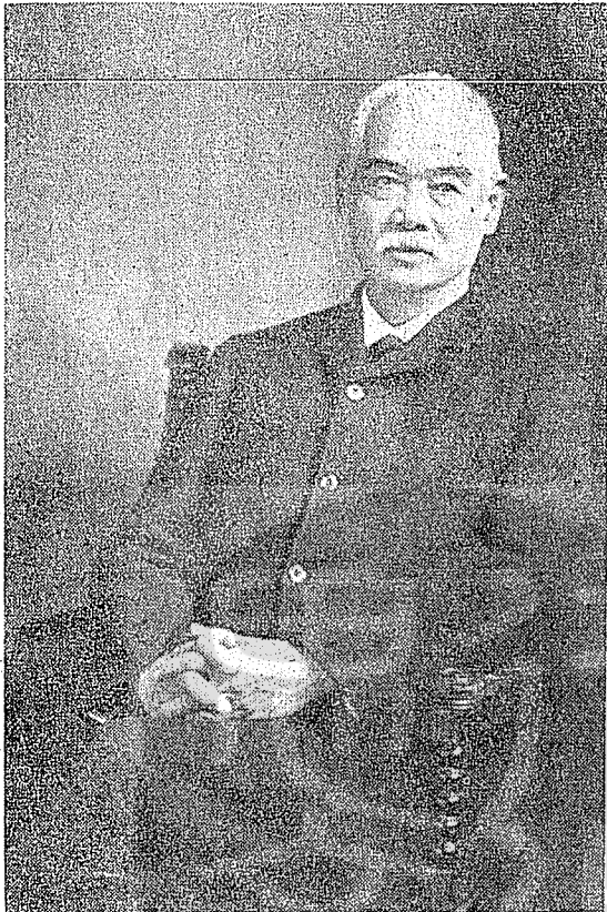
晚年時期，僑居美國的容閔博士。

由於江南製造局採納容閔建議，附設兵工學校，訓練出許多技師及工程師等，對中國現代化奠定良好基礎。因此曾對容閔非常賞識。這時候容閔改任上海當局的翻譯，由於工作上的關係，他和江蘇巡撫丁日昌很熟。丁為人精明能幹，是前進派份子，勇於做事。容對其派遣留學生出國接受西方教育的計劃也曾向丁陳述過，並獲得丁的贊助和支持，只是時機尚未成熟，未能向清廷上奏。