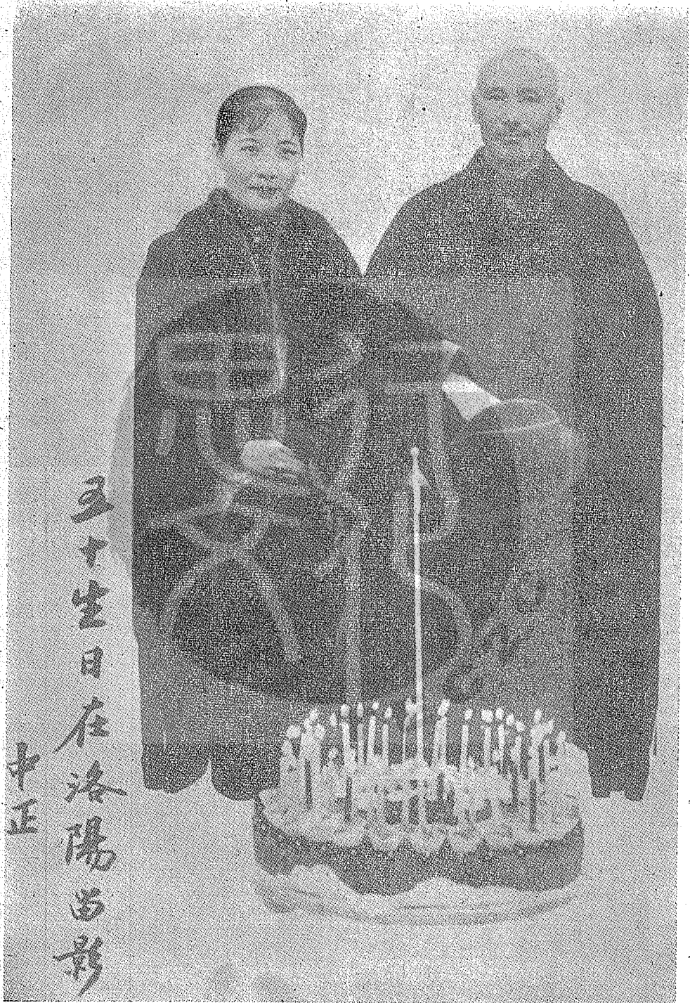
蔣委員長十五華誕與夫人洛陽合影