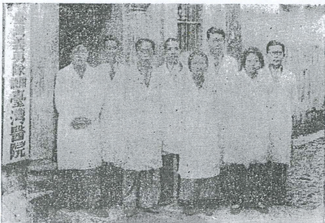
臺灣義勇總隊附設台灣醫院醫師及醫務人員合影。

。像這樣一支在戰時前線後方具有七年艱辛作戰經驗且有戰果的隊伍，怎會在金華「聽到砲聲，趕緊逃命」，「立刻作鳥獸散」呢？事實證明，台灣義勇總隊不特沒作鳥獸散，在長期艱苦的抗戰陣線裡，在敵人砲火的洗擊下，却益趨強大茁壯，戰鬥工作的層面地區也益更廣闊，對祖國抗戰的貢獻，迭曾受到政府當局的重視鼓勵與社會