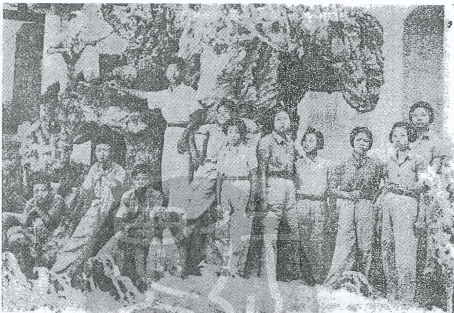
。影留上山夷武在員隊女隊總勇義灣台的戰聖日抗加參