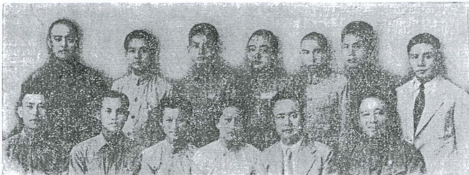
民國三十三年九月三日抗日戰勝紀念日，福建省龍巖各縣各界送李總隊長，前右三為本文（前右二為余書記）合留影念，前左二為（前左二為余書記）